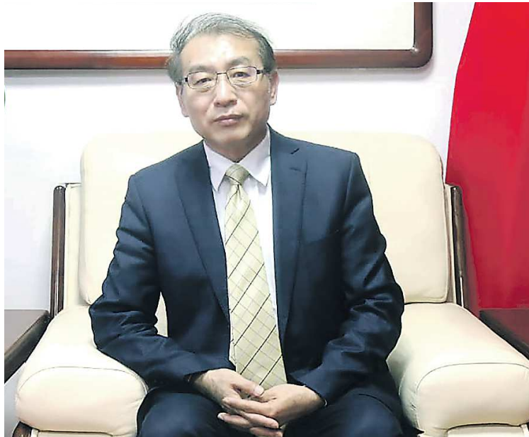
ГЕНЕРАЛЬНОЕ ПОСОЛЬСТВО КНР / РФ

В этом году инициативе «Один пояс, один путь» исполняется десять