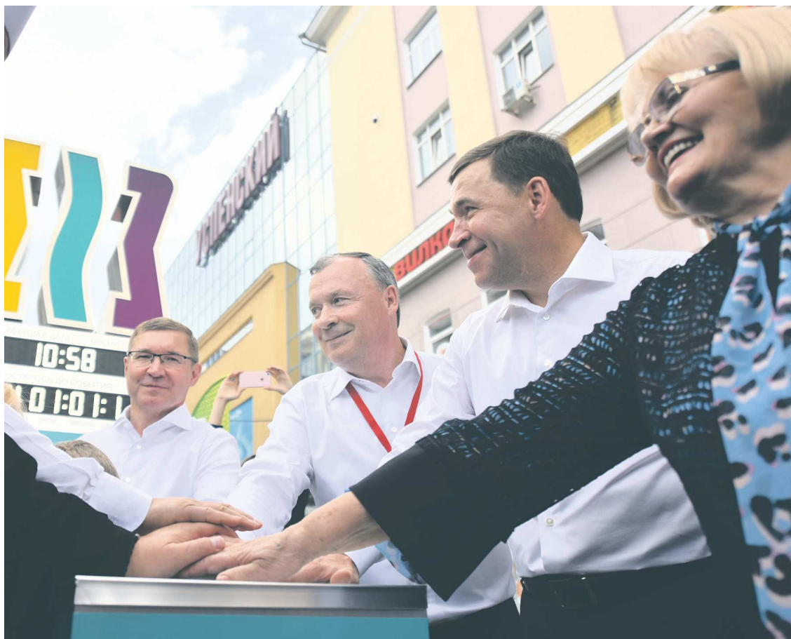
Полномочный представитель Президента России в УрФО Владимир Якушев, глава Екатеринбурга Алексей Орлов, губернатор Евгений Куйвашев и председатель Законодательного Собрания Людмила Бабушкина в День города Екатеринбурга 20 августа 2022 года