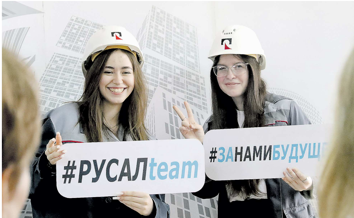
Престиж рабочих профессий растет год от года

Показательный пример – Североуральск, где местный политехникум вошел в металлургический кластер. Семьдесят пять первокурсников заведения – будущие ремонтники горного оборудования, техники-электромеханики и сварщики – стали участниками фе-