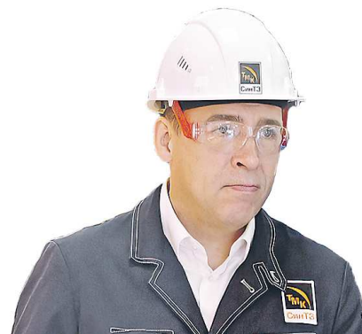
Евгений КУЙВАШЕВ, губернатор Свердловской области

Из выступления на пленарном заседании съезда РСПП