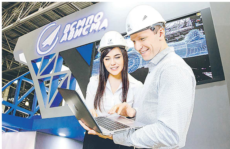
Проект «Профессионалитет» позволяет в кратчайшие сроки освоить востребованную специальность

В 2022 году Верхнесалдинский авиаметаллургический колледж им. А. А. Евстигнеева (ВСАМК) совместно с Корпорацией ВСМПО-АВИСМА выиграли конкурс на получение грантов в рамках федерального проекта «Профессионалитет». Более 200 миллионов рублей из федерального и регионального бюджетов, а также бюджета Корпорации были направлены на создание современных мастерских, лабораторий, аудиторий, приобретение оборудования. А совсем скоро состоится открытие нового студенческого общежития.