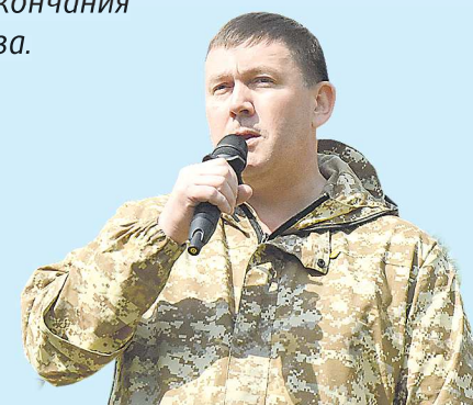
Алексей ШМЫКОВ, первый заместитель губернатора Свердловской области

“ «Сегодня запрос у предприятий огромный, в том числе у предприятий оборонного комплекса. В идеале, если молодой рабочий или инженер придет на рабочее место сразу же после окончания колледжа или вуза. Там выучат его, что называется, «под себя».