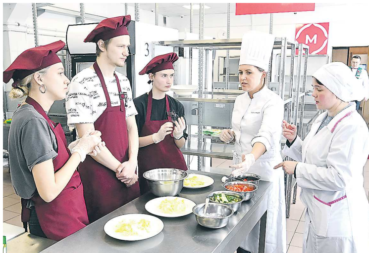
Техникум индустрии питания и услуг «Кулинар» станет одной из учебно-производственных баз для новых кластеров

Новые кластеры системы среднего профессионального образования появятся в Свердловской области. Минпросвещения России одобрило заявку региона на федеральное финансирование трех образовательных центров, направленные по решению губернатора Свердловской области Евгения КУЙВАШЕВА . Свыше 200 миллионов рублей пойдет на развитие одного кластера по направлению «Педагогика» и двух – «Туризм и сфера услуг».