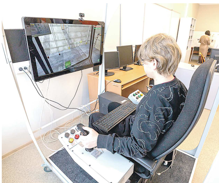
Совместная работа по проекту «Профессионалитет» укрепила взаимодействие компании со специальными учебными заведениями, конечная выгода – обоюдная

Трубная Металлургическая Компания начала предварительную работу по участию в «Профессионалитете» еще до старта проекта. В Полевском и Каменске-Уральском обучение в рамках проекта началось в сентябре 2022 года. Работу координирует Корпоративный университет ТМК2U. Сегодня предприятия компании активно участвуют в реализации инициативы вместе со специальными