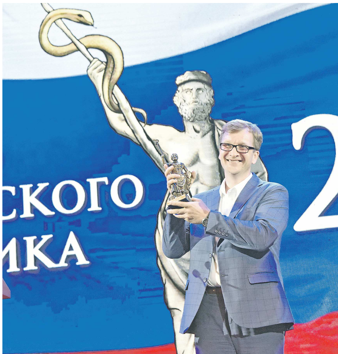
По традиции премии вручают накануне Дня медицинского работника

О героях премии «Медицинский Олимп-2023» читайте в ближайших номерах «Областной газеты»