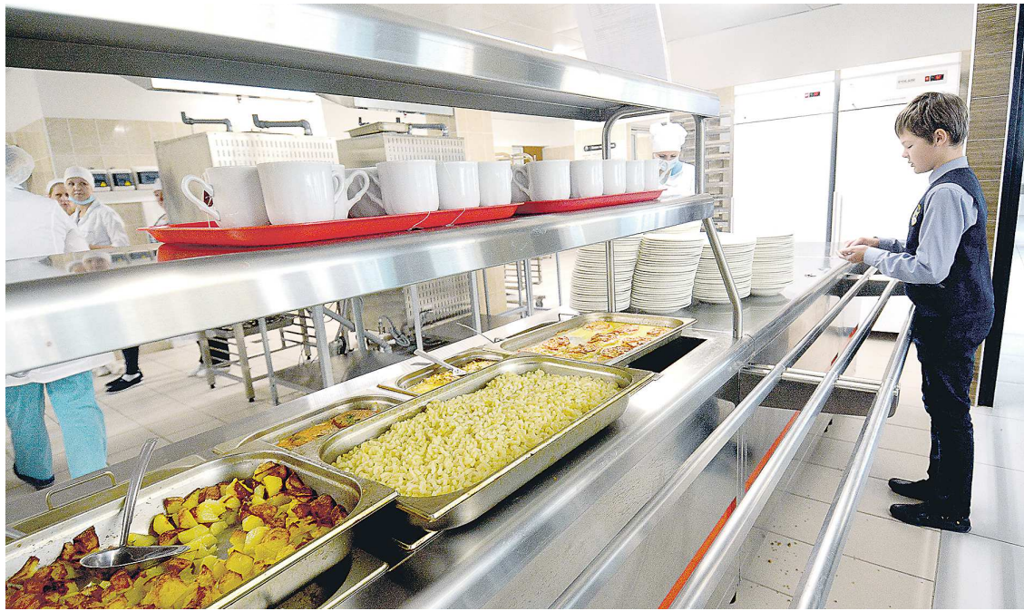
Ежедневное горячее питание в школах – одна из мер поддержки детей участников СВО

Расширен перечень семей, которые могут получить эти льготы. Раньше к этим категориям относились дети из семей