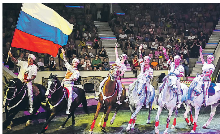
Наездники-трюкачи приветствовали зрителей с российским триколором

Оно прошло 12 июня, в День России, по инициативе Росгосцирка. Такая акция состоялась еще в 19 российских городах.