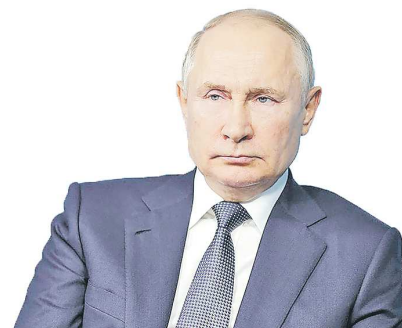
Владимир Путин, Президент России

Поддержка земляков. Забота о семьях. Воспитание патриотизма