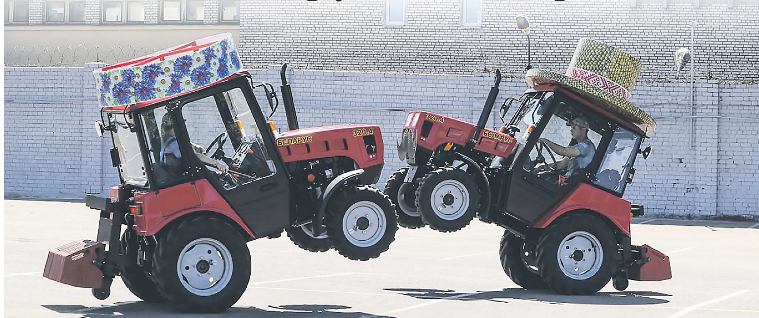
ИНФОРМАЦИОННОЕ АГЕНТСТВО МИНСКНОВОСТИ

Только ради танцующих тракторов стоит посетить фестиваль