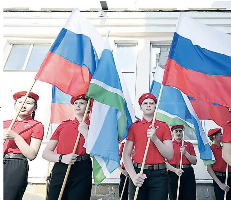
ДЕПАРТАМЕНТ ИНФОРМАТИКИ СВЕРДЛОВСКОЙ ОБЛАСТИ

В открытии филиала Фонда приняли участие свердловские волонтеры