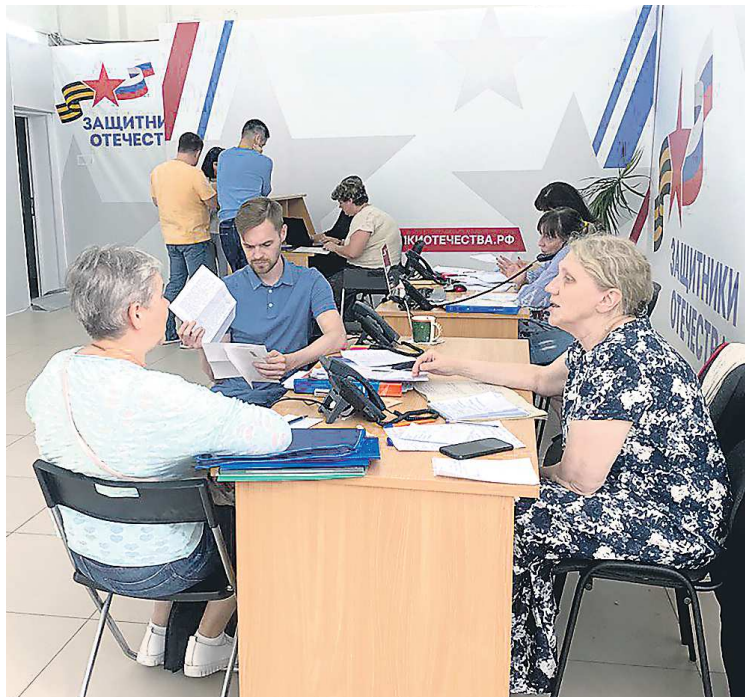
Филиал Фонда востребован: каждый день сюда приходят свердловчане

Много вопросов, с которыми сюда приходят, связаны с нотариальными и юридическими аспектами. В связи с этим руководство филиала Фонда «Защитники Отечества» подписало соглашение о сотрудничестве с Нотариальной палатой региона и с Государственным юридическим бюро Свердловской области. Теперь нотариусы и юристы будут бесплатно оказывать помощь, связанную с предоставлением мер социальной поддержки, оформлением (восстановлением) документов и получением статуса ветерана боевых действий, а также правовым информированием ветеранов и членов их семей по вопросам совершения нотариальных дей-