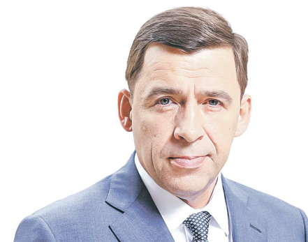
Евгений КУЙВАШЕВ, губернатор Свердловской области

«В 2022 году Нижний Тагил отметил 300-летие. К этому моменту в городе уже многое было сделано, и тагильчане наверняка это видят. Но не нужно останавливаться на достигнутом. Мы обязательно продолжим развивать Нижний Тагил. Привлекать новые инвестиции, туристов. Планов огромное количество. Это для нас один из серьезнейших приоритетов.»