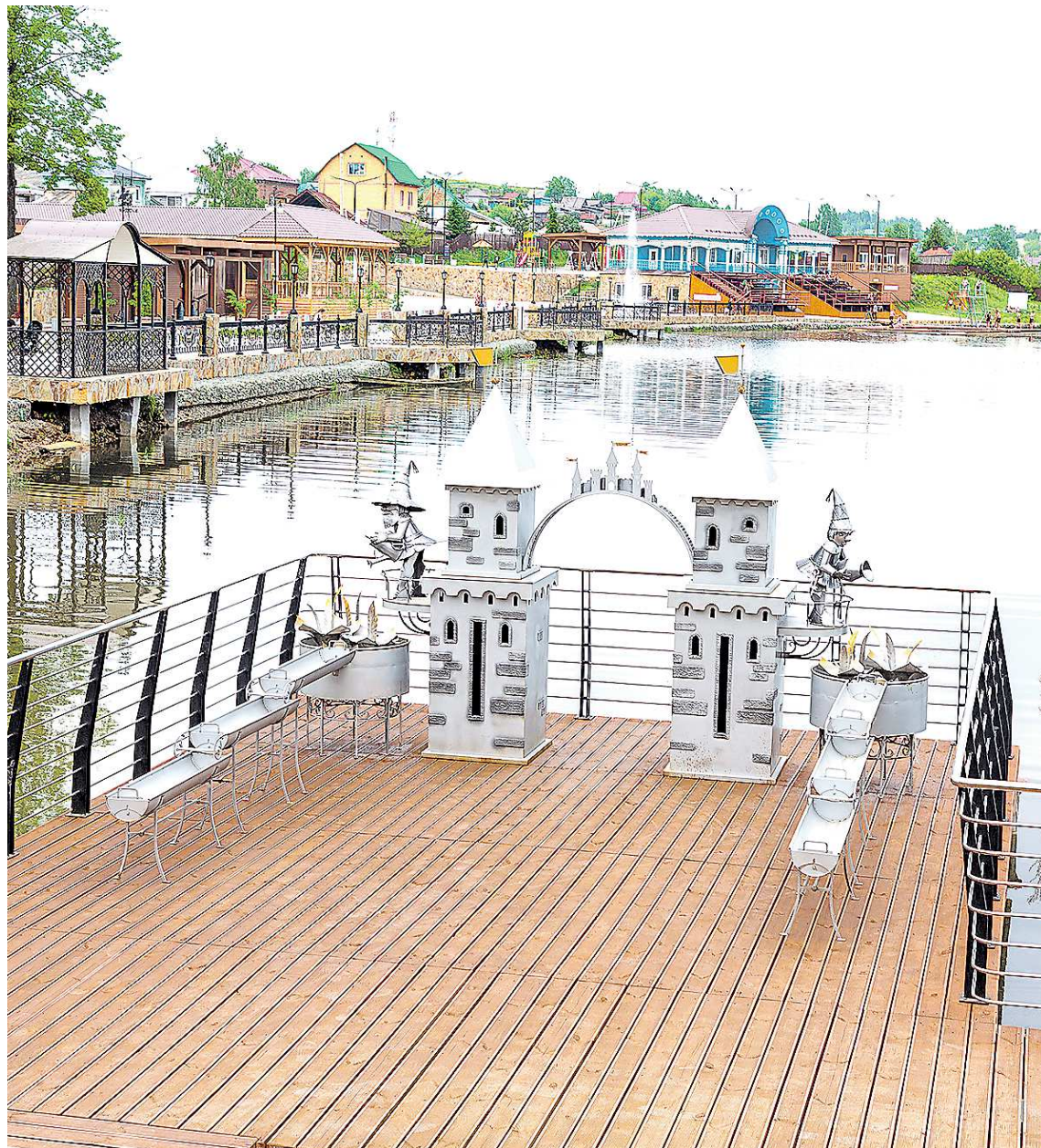
Город чудес для набережной Верхней Туры изготовили мастера из Лесного