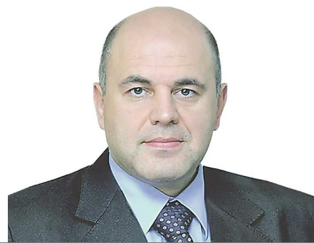
Михаил МИШУСТИН, председатель Правительства Российской Федерации

«Уровень жизни наших людей везде, в любой точке страны, должен быть достойным, а бытовые условия – комфортными. Сегодня малым городам, в отличие от крупных, не под силу решить многие проблемы, поэтому федеральное правительство принимает меры, чтобы их поддержать. Региональные власти тоже должны уделять им внимание. И находить для этого новые формы, которые подходят именно для этих малых городов.»