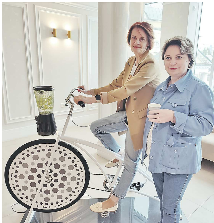
На конгрессе гостям был представлен велотренажер, дающий возможность сделать полезные для здоровья смузи, просто крутя педали велотренажера

Участники конгресса в ходе обсуждений уделили внимание особенностям работы со старшим поколением и успешным практикам, получившим распространение после пандемии новой коронавирусной инфекции. Показательным стал опыт взаимодействия Центра общественного здоровья и медицинской профилактики с муниципальным объединением библиотек Екатеринбурга и культурным центром «Минора», направленный на профилактику хронических неинфекционных заболеваний, деменции, укрепление психологического здо-