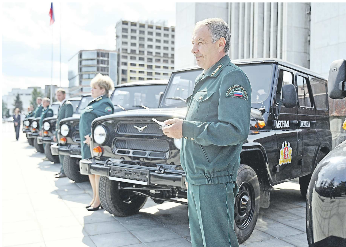
На закупку внедорожников из федерального бюджета было выделено более 27 млн рублей

– Внедорожники повысят мобильность лесных инспекторов, лесной охраны, они позволят более качественно осуществлять работу как в повседневной службе, так и при патру-