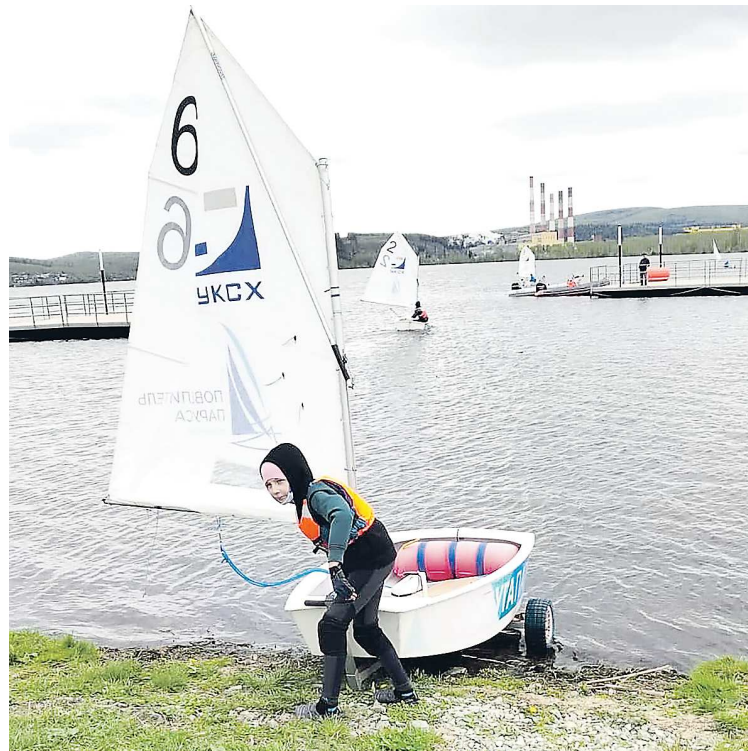
Яхты для тренировок — специальные, маломерные, чтобы парусным спортом могли заниматься и дети

О возрождении школы заговорили в прошлом году, когда в городе открылась благоустроенная набережная под названием «Набережная огней». На площади в девять гектаров расположились игровые зоны, спортивные площадки, беседки, различные арт-объекты, а также понтоны с выходом к воде. Проект стоимостью четверть миллиона рублей удалось реализовать благодаря победе Верхнего Тагила во Всероссийском конкурсе проектов