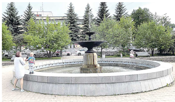
Водный напор пока небольшой, но в ближайшее время фонтан «разойдется»

Фонтан будет работать все лето в ежедневном режиме с 09.00 до 22.00. Вокруг него любят прогуливаться мамочки с детьми (на фото), подростки и пожилые люди. В соцсетях новость о возобновлении работы фонтана жители встретили на ура.