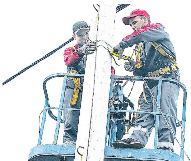
Для монтажа новых светильников на опоры электрики используют специальную вышку