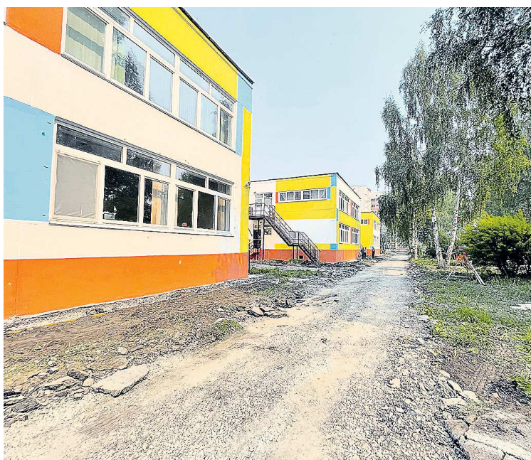
К концу июня вокруг детского сада сделают комфортные асфальтовые дорожки

— Детский сад должен быть комфортным для малышей во всех отношениях. Это не только теплые, уютные группы, но внешний вид учреждения и прилегающая территория. Сейчас эти работы выполняются. Окончание по контракту — конец августа, но подрядчик планирует сдать объект уже к началу июня, — сообщил Вячеслав Тюменцев.