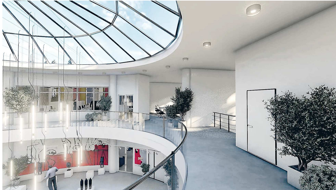
Так будет выглядеть холл Центра развития культуры в Кировграде

Центр культурного развития будет построен в самом центре Кировграда. Сейчас на этом месте находится бывший кино-