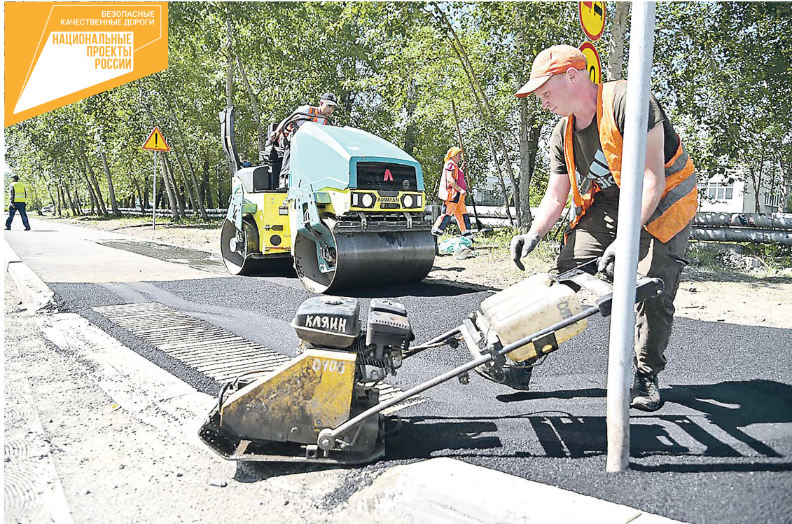
В нацпроекте «Безопасные качественные дороги» Нижний Тагил участвует с 2019 года

Стоимость проекта – 470 млн рублей. Он реализуется