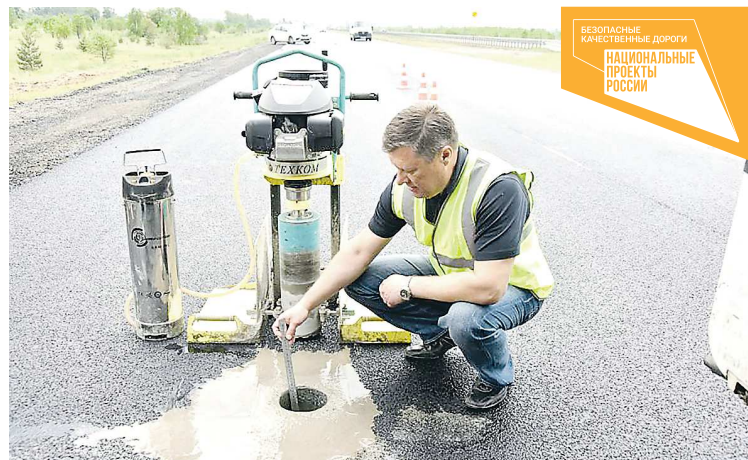
Один из способов проверки — отбор кернов. Это вырезание образцов породы в скважине и извлечение их на поверхность для исследования

— Сначала проводится входной контроль материалов. Затем операционный контроль, когда заказчик и подрядчик совместно контролируют ход строительно-монтажных работ и соблюдение параметров. А завершает