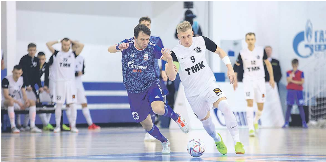
Матчи в Югорске получились яркими по накалу