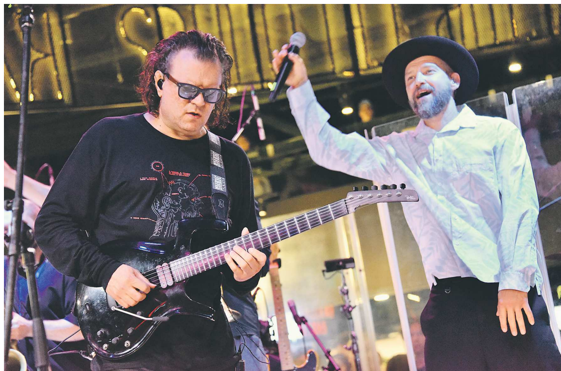
Группа «Uta2rman» – один из хедлайнеров фестиваля «Кардиограмма»