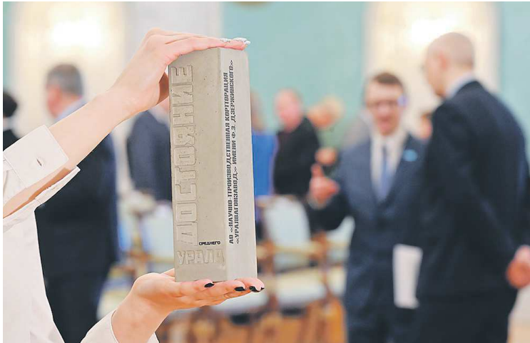
Победитель конкурса «Достояние Среднего Урала» получит награду 17 января 2024 года – в День 90-летия образования Свердловской области

Конкурс общественного признания «Достояние Среднего Урала» проводится уже второй год по инициативе губернатора Евгения Куйвашева . Статус «Достояния» может быть присвоен географическим объектам, историческим событиям, достижениям науки, художественной культуры, спорта, традиционным мероприятиям, коллективам и организациям.