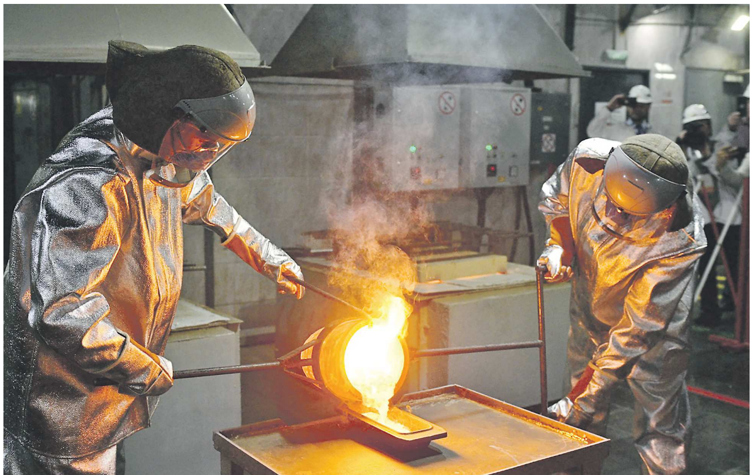
В присутствии губернатора был отлит восьмиклограммовый золотой слиток

Производство полностью обеспечит переработку полиметаллической руды из месторождений в районе Краснотурьинска, Ивделя, Карпинска, а в перспективе и из других территорий. Этот инвестиционный проект считается одной из ключевых точек роста экономики Северного Урала. Строи-