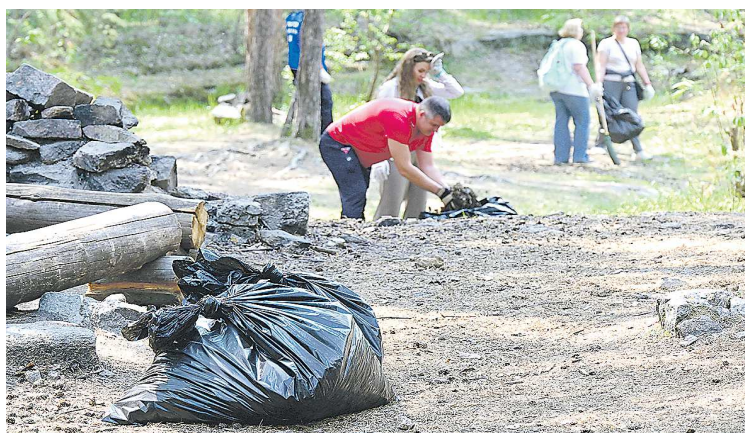
Собранный на стихийных свалках мусор регоператоры собирают и вывозят на полигоны

Как сообщила пресс-служба компании, очистка территорий проводилась органами местного самоуправления после получения уведомления от регоператора об обнаружении свалок. Средний объем мусора, оставленного в непопулярных местах (в основном, в лесных массивах), составил 3-5 кубометров. Это намного меньше среднего объема выявляемых скоплений мусора