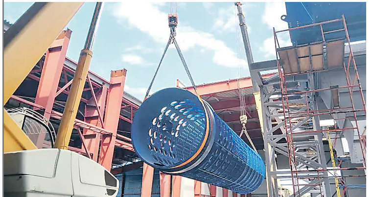
Практически все оборудование комплекса – российского производства

К строительству мусоросортировочного комплекса в Нижнем Тагиле АО «Облкоммунэнерго» приступило в марте 2022 года по концессионному соглашению с мэрией. Стоимость объекта – 3,3 млрд рублей, мощность – 185 тысяч тонн отходов в год. Завод будет принимать отходы Нижнего Тагила, Горноуральского и Невьянского округов. Ввести его в эксплуатацию планируется в конце 2023 года.