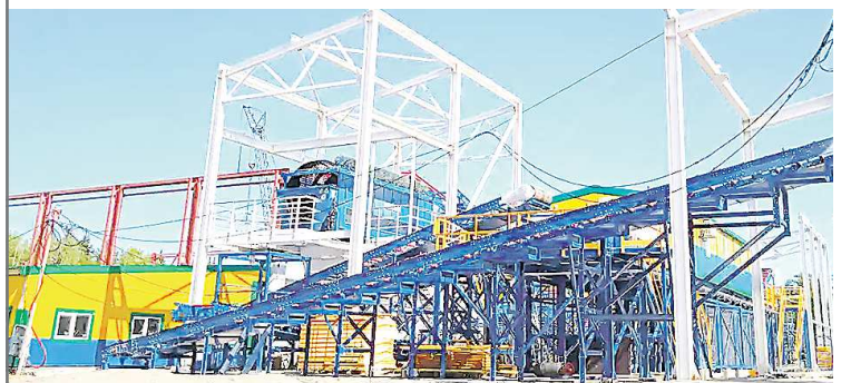
Уже с этого лета мусоросортировочный комплекс в Краснотурьинске начнет перерабатывать отходы севера области