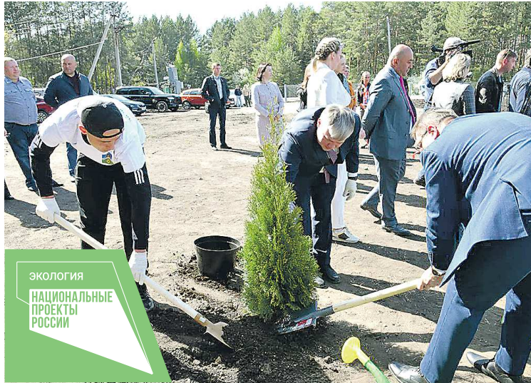
Озеленять рекультивированную территорию бывшей свалки арамильские власти планируют регулярно

ДЕПАРТАМЕНТ ИНФОРМАТИКИ СВЕРДЛОВСКОЙ ОБЛАСТИ