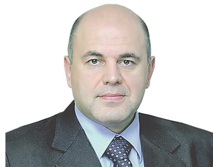
Михаил МИШУСТИН, председатель Правительства Российской Федерации

“Голосование дает хорошую возможность сделать собственный город, поселок комфортнее и удобнее для жизни. Хорошо, что все больше людей участвуют в отборе и выражают свое мнение. Такая обратная связь, о которой говорит Президент России Владимир Путин, очень важна. Теперь необходимо, чтобы все выбранные проекты были реализованы на высоком уровне.