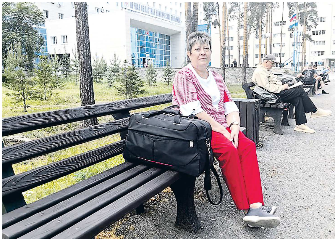
Лавочки из переработанного пластика уже оценили пациенты больницы

– Этот совместный проект нацелен на формирование у жите-