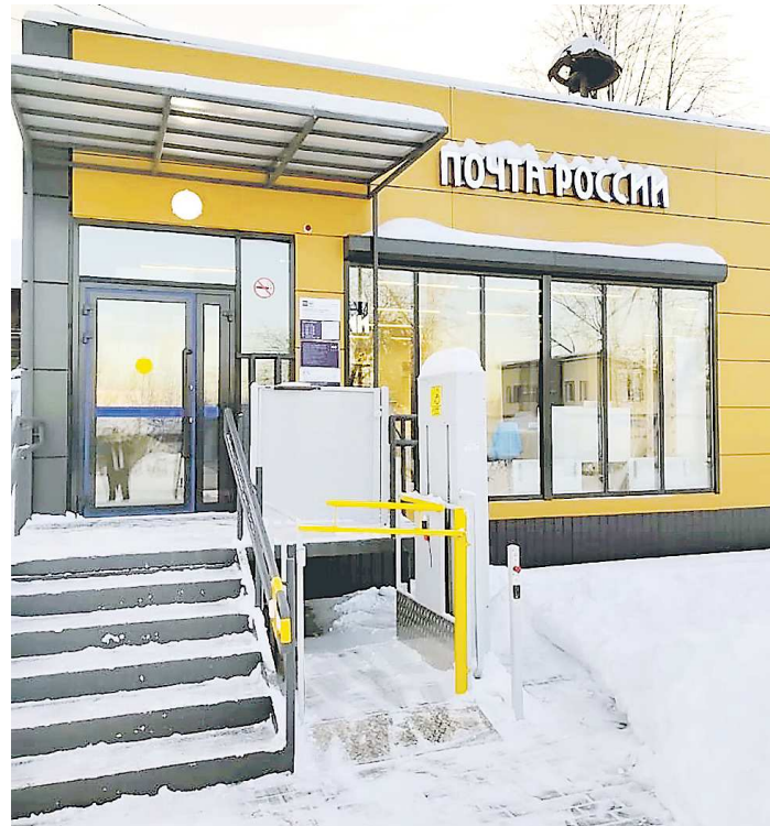
Новое отделение Почты России в Черноисточинске выглядит очень презентабельно

Отделение почтовой связи в поселке Черноисточинск Горноуральского ГО, которое обслуживает более 4 тысячи человек, переехало