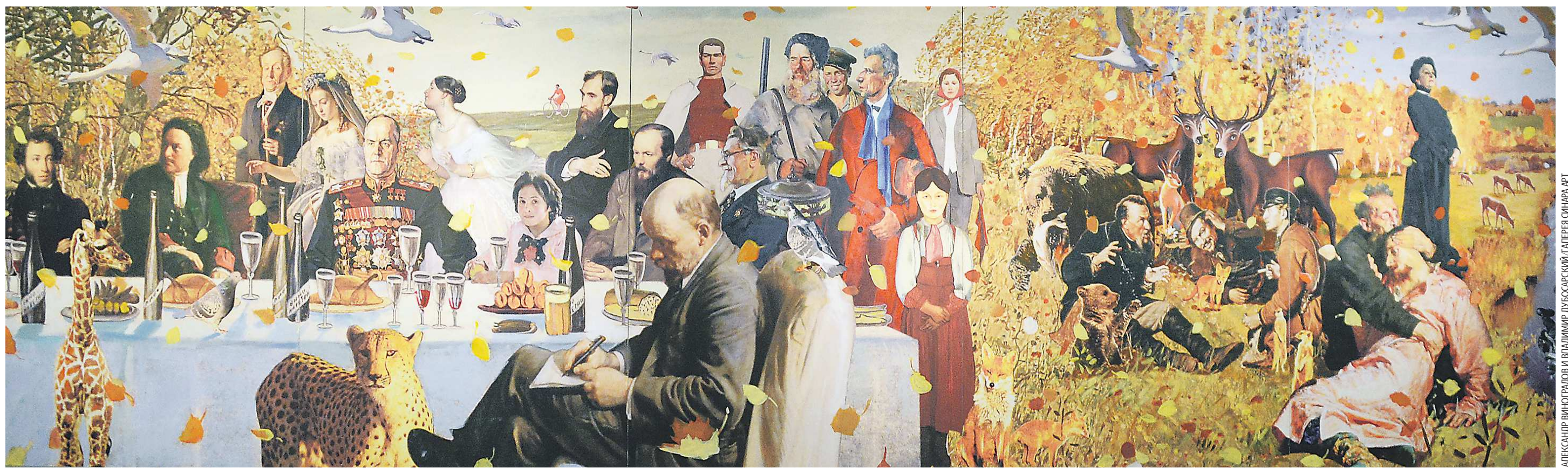
Полотно «Осень» из цикла «Времена года русской живописи» творческого дуэта Александра Виноградова и Владимира Дубосарского. Картина имеет внушительные размеры – 7 х 2 метра – и состоит из нескольких сборных блоков

На четырех полотнах – 350 самых известных картин русского искусства