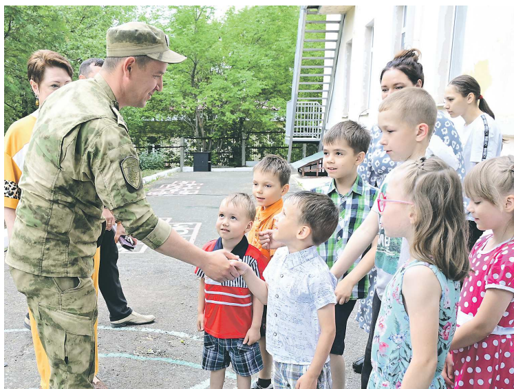
Подаркам от войсковой части дети были особенно рады, они часто приходят к военным в гости и давно дружат

В честь Дня защиты детей руководство центра устроило ребятам незабываемый праздник. В гости к ним приехал первый заместитель министра со-