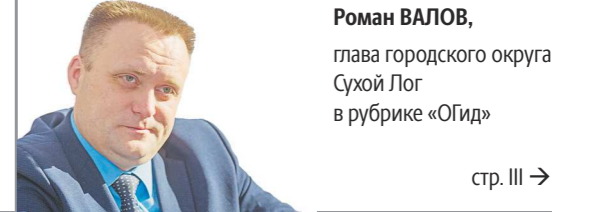
Роман ВАЛОВ, глава городского округа Сухой Лог в рубрике «ОГид»

«Самое главное – активная занятость человека: либо спортивная, либо культурная. Так что открываем афишу, читаем «Облазету», выбираем событие и идем!»