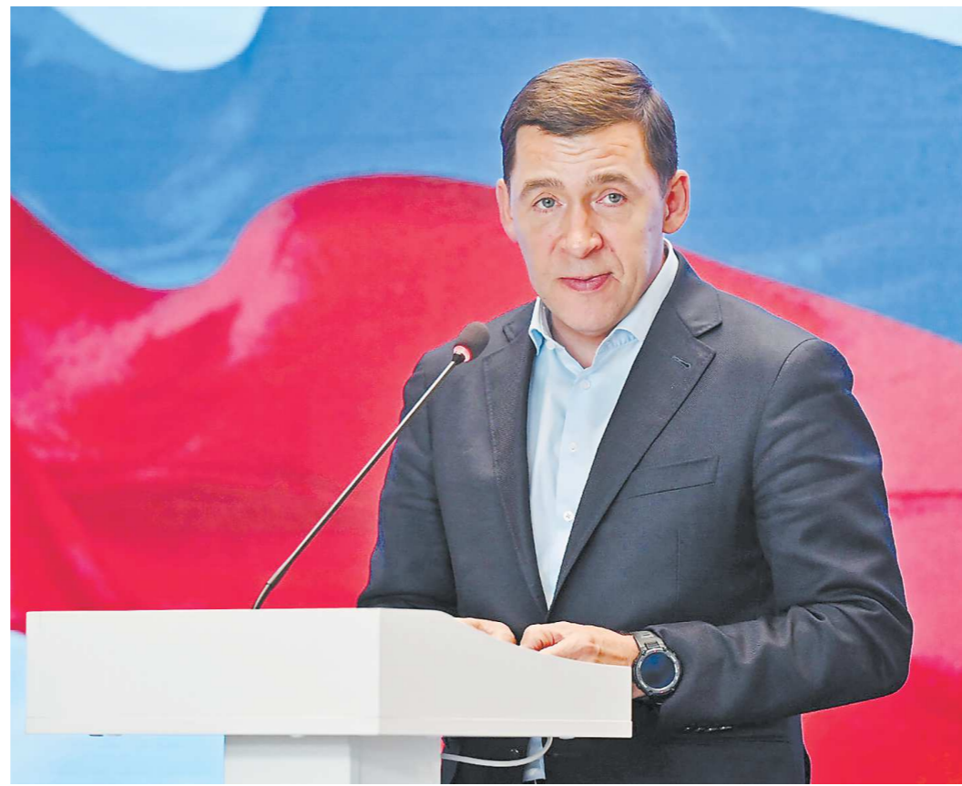
Евгений Куйвашев второй раз принимает участие в праймериз кандидатов «Единой России» по выборам свердловского губернатора