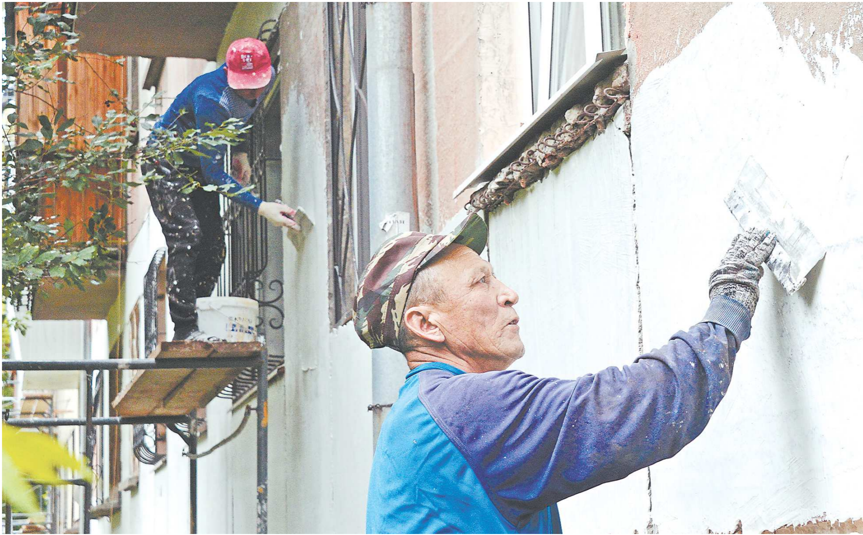
В перечень работ по капремонту входит: обновление фасада и кровли дома, укрепление фундамента, замена внутренних коммуникаций (тепло-, водо-, электроснабжение), лифтов и ремонт подвальных помещений

Такое решение стало реакцией на выступление в конце мая на заседании заксобрании областного министра энергетики и ЖКХ Николая Смирнова. Глава ведомства сообщил, что с реализацией программы капремонта могут возникнуть проблемы. Согласно плану, в нынешнем году на ремонт 1 323 многоквартирных домов выделено 9,5 млрд рублей. Но в реальности цена вопроса может оказаться куда выше.