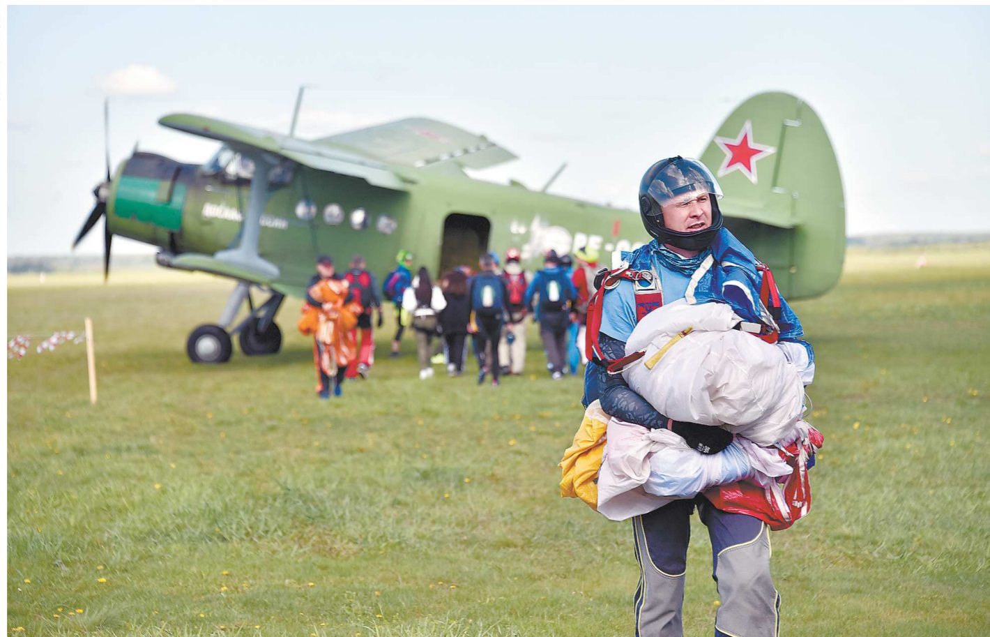
На аэродроме Логиново можно совершить два вида прыжков: в тандеме с инструктором и самостоятельно, после прохождения инструктора

На лекции рассказывали о рекордах и достижениях в мире парашютного спорта, порой действительно граничащих с безумствами. Например, о российском спортсме-