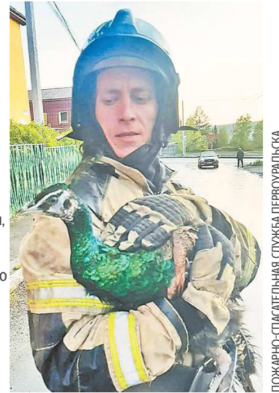
ПОЖАРНО-СПАСАТЕЛЬНАЯ СЛУЖБА ПЕРВОУРАЛЬСКА

Птица сбежала из частного сектора и отправилась изучать окружающий мир. Путешествие закончилось на территории детского сада «Филипок» – там павлин залез на дерево и запутался в ветках. Поняв, что самостоятельно питомцу не выбраться, хозяйка решила вызвать МЧС. Операция по спасению павлина заняла несколько минут. Пожарные поднялись по лестнице, сняли птицу с дерева и вернули ее хозяйке.