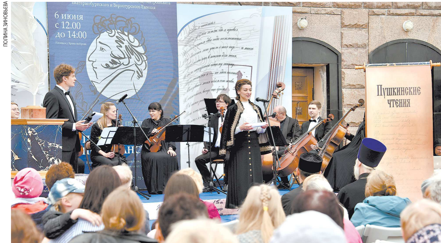
Под стенами Храма-на-Крови каждый желающий мог выйти на сцену и прочитать стихотворения Александра Пушкина или собственного сочинения

Затем наступила пора более взрослых и опытных выступающих. На сцену поднялась народная артистка России, актриса Государственного академического теа-