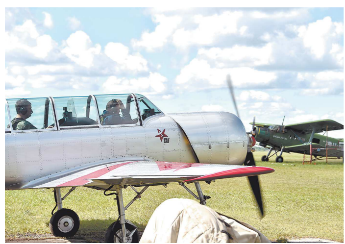
Гости могли подняться в небо и пролететь над окрестностями аэродрома