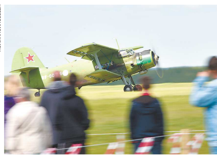
Каждый день в Логиново происходит порядка 50 взлетов