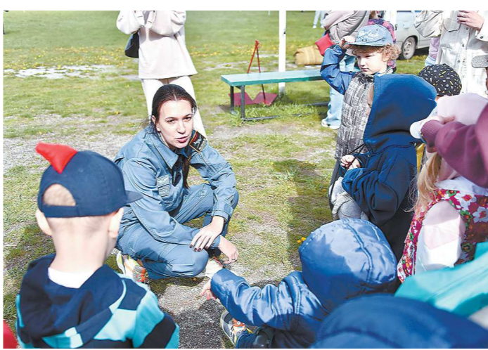
Во время праздника на аэродроме работал детский сад