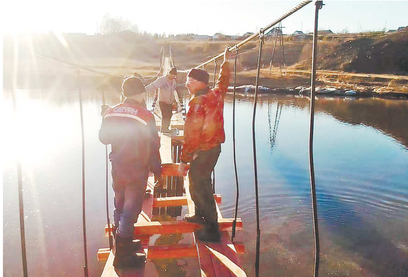
Инициативные сельчане уже уложили на пешеходном мостике настил. Осталось сделать поручни

Между тем включать мост в реестр муниципальных объектов чиновники не собираются. Более того, недавно бы-