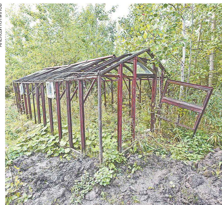
Такие участки создают угрозу пожаров