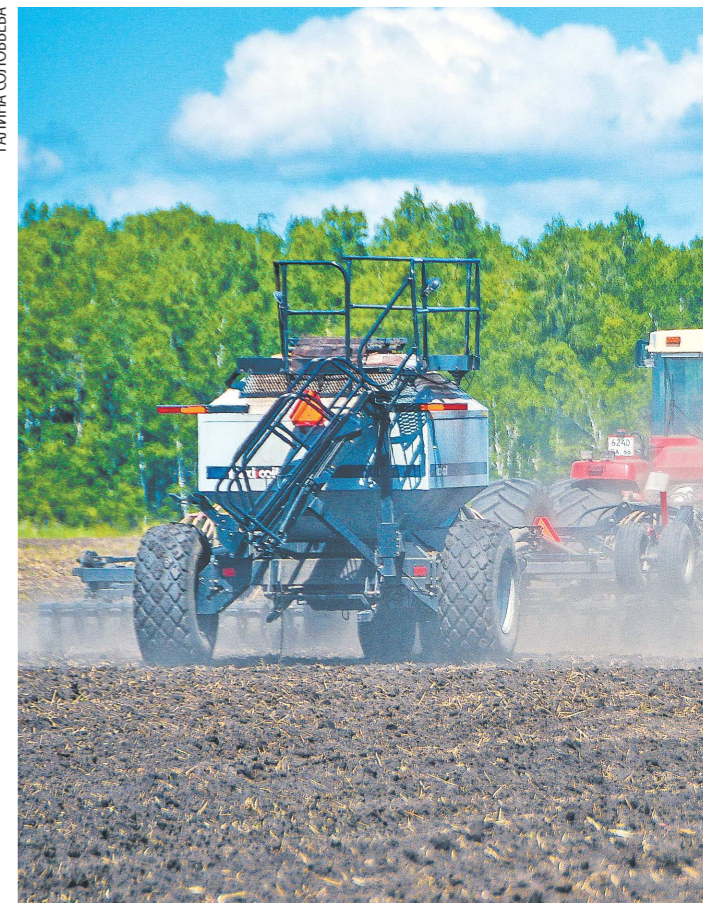
Дожди в этом сезоне немного задержали посевную кампанию