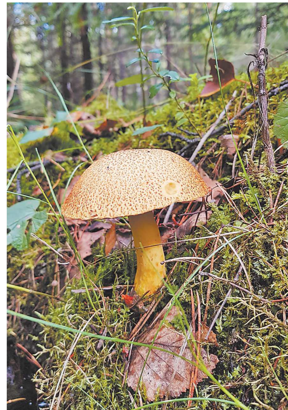
Маслята в мае массово появились в лесах в Белоярском районе, под Полевским, в направлении Серовского тракта