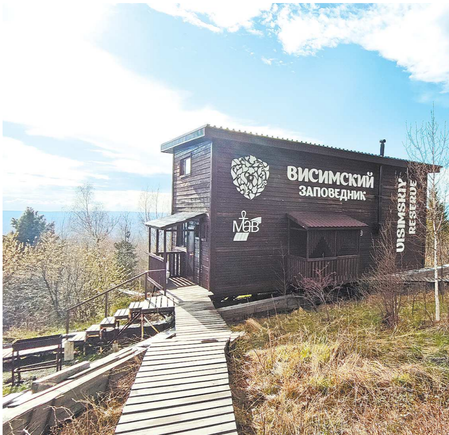
В 2001 году заповеднику был присвоен статус биосферного резервата ЮНЕСКО

«Областная газета» составляет свой рейтинг, ждем предложений от наших читателей.