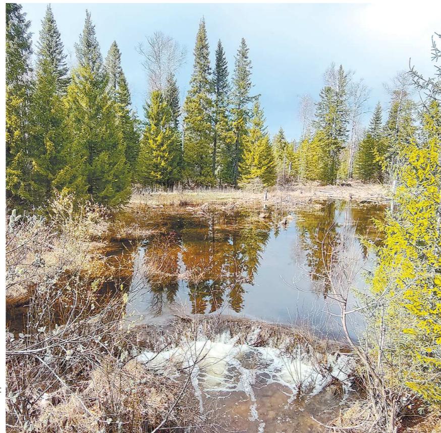
Озер у Висимского заповедника нет, но есть три болотистые местности