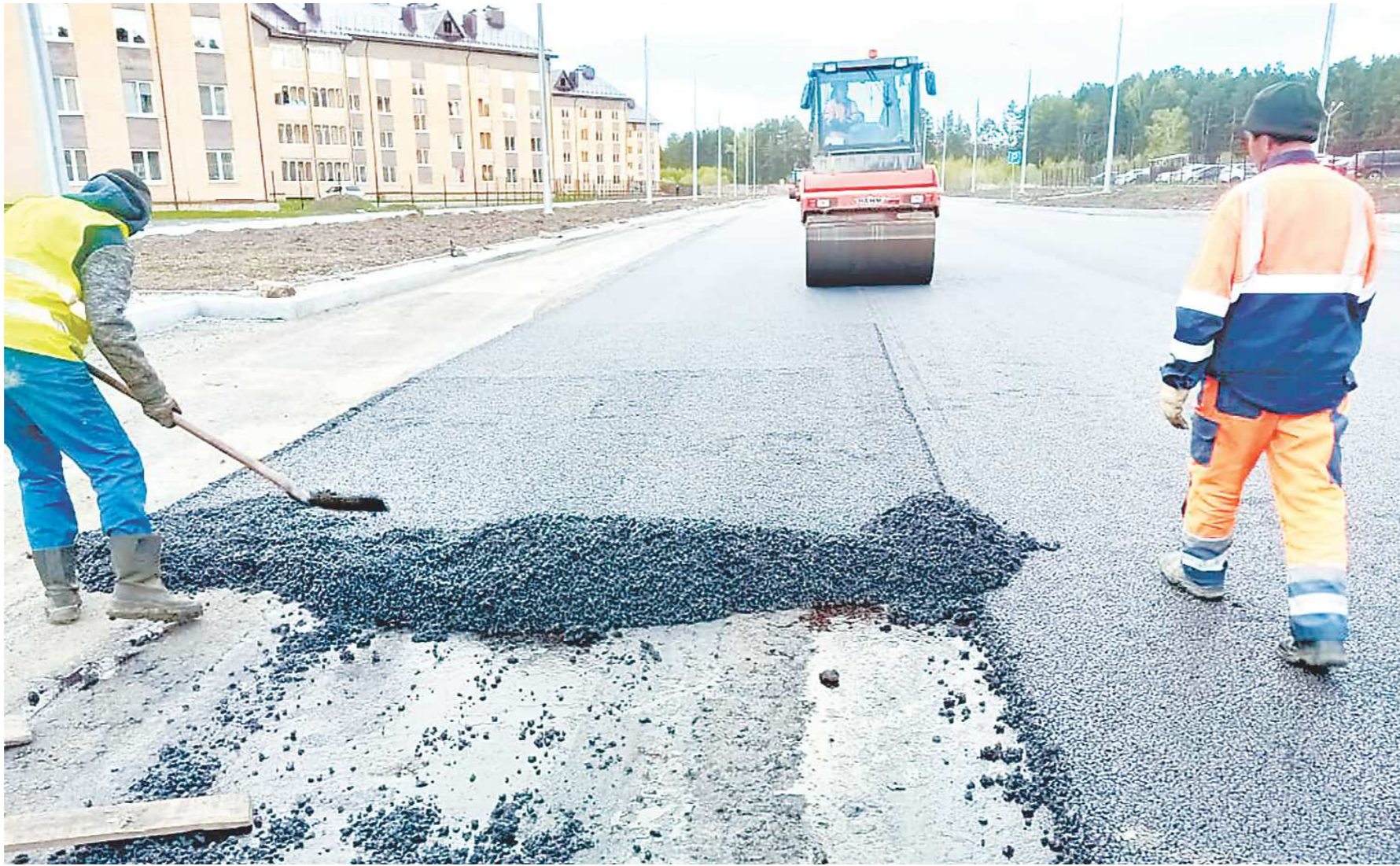
На момент подготовки номера на Александровском проспекте в Березовском оставалось положить 80 метров асфальта