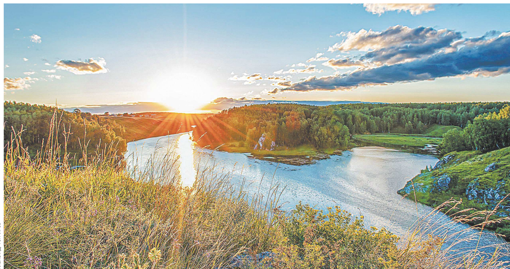
В месте слияния рек Исети и Каменки особенно красиво