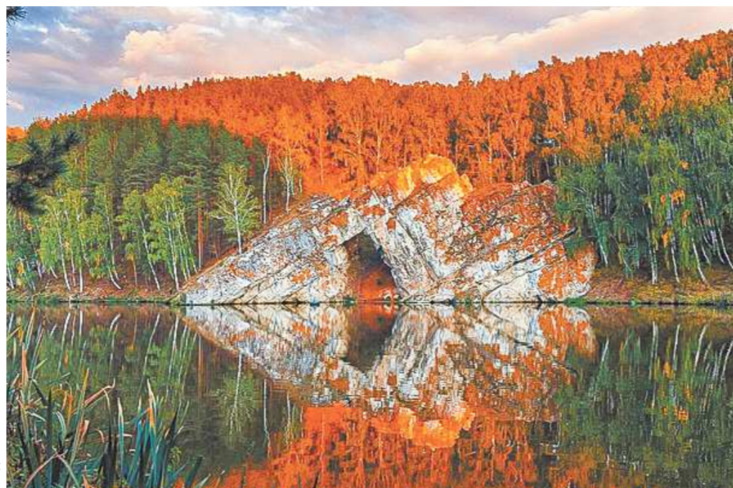
Говорят, если пройти через Каменные ворота, то обязательно встретишь настоящую любовь...

Исеть все бежала к любимому, и вот на ее пути встала каменная стена. Исеть стала биться о стену и пробилась ее силой своей любви. Получились из этого Каменные ворота – памятник природы. Исеть устала, но ее силы подкрепили маленькие речки: Синара, Катайка, Теча, Канаш, Мостовка, Миасс. Исеть побегала быстрее и, наконец, встретила Тобола и бросилась в его объятия.