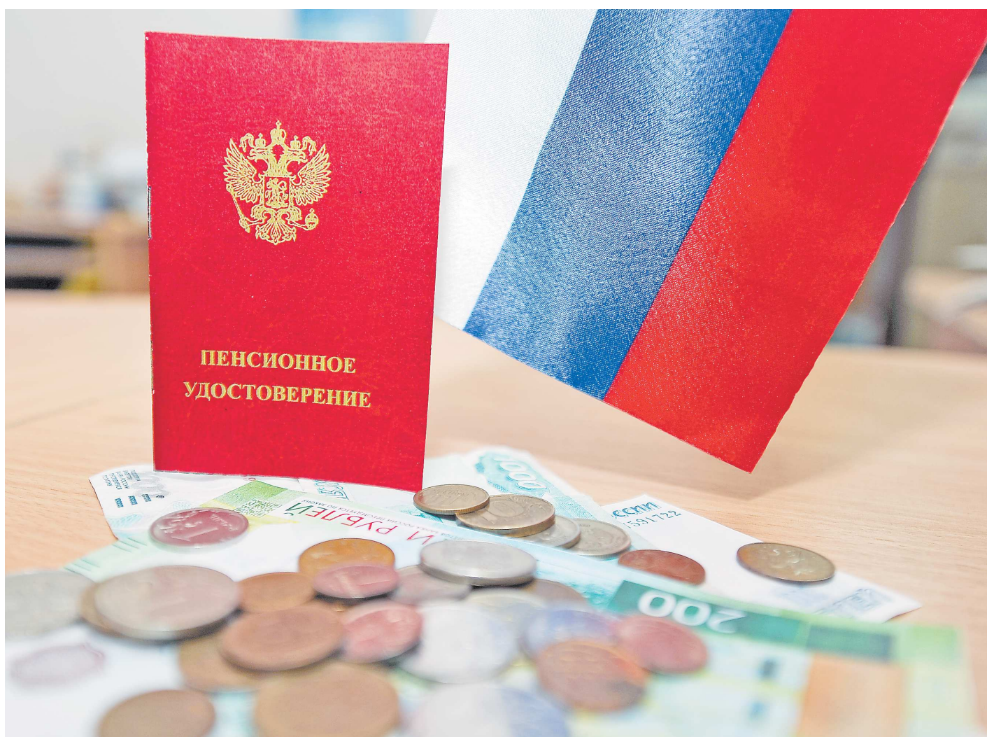
Пока малообеспеченным свердловчанам, несмотря на поддержку государства, приходится считать каждую копейку

К концу 2022 года власти региона планируют снизить