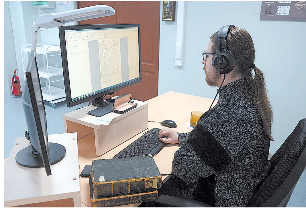
Сотни уральских IT-компаний смогут претендовать на господдержку