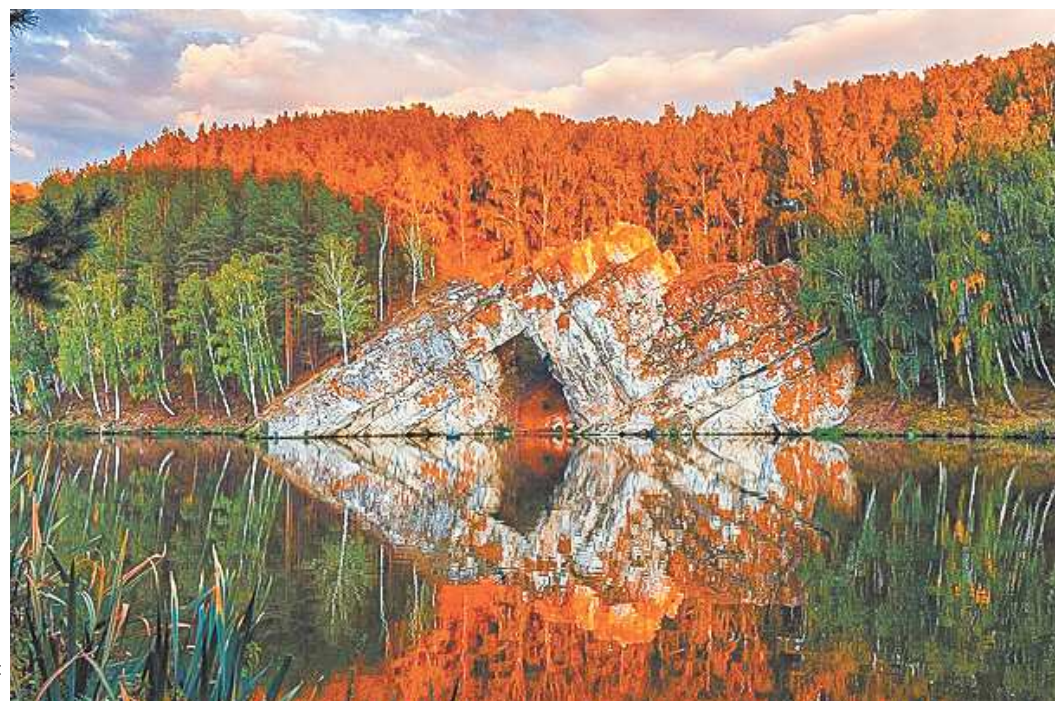
Говорят, если пройти через Каменные ворота, то обязательно встретишь настоящую любовь...

Исеть все бежала к любимому, и вот на ее пути встала каменная стена. Исеть стала биться о стену и пробилась ее силой своей любви. Получились из этого Каменные ворота – памятник природы. Исеть устала, но ее силы подкрепили маленькие речки: Синара, Катайка, Теча, Канаш, Мостовка, Миасс. Исеть побегала быстрее и, наконец, встретила Тобола и бросилась в его объятия.