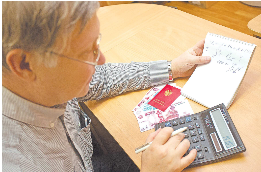
Социальные выплаты регулярно индексируют, чтобы не усугублять положение людей

«В феврале мы потратили на еду около 28 тысяч, остальные деньги ушли на оплату коммуналки, покупку лекарств для моего папы и выплату по кредиту. Ни о каких сбережениях даже не ду-