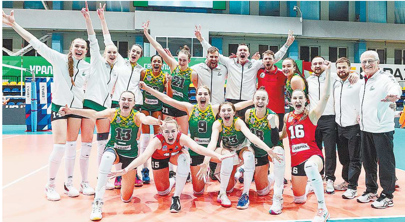
Победное эмоциональное фото свердловской команды

Ответная игра проходила в Нижнем Тагиле, и за десять минут до начала матча на трибунах почти не было свободных мест. Плюс, конечно, стоит отметить «десант» болельщиков из «Сималенды», которые заняли целый сектор и с помощью барабанов, атрибутики и кричалок создали в зале непередаваемую атмосферу. При такой поддержке «Ура-