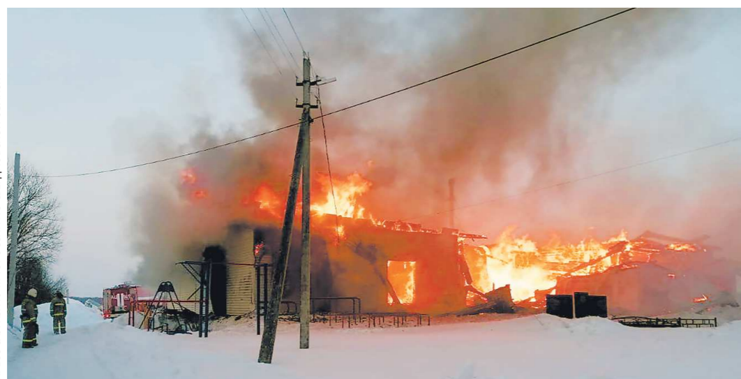
На тушение здания у пожарных ушло полночи. Пламя стремительно распространилось по деревянным конструкциям, ситуацию осложнил сильный ветер

Недавно в деревне Озёрки, одной из самых отдаленных и труднодоступных в Таборинском районе, сгорел культурно-досуговый центр. Администрация поселения придумала, как решить проблему – под клуб отдадут здание бывшего детского сада.