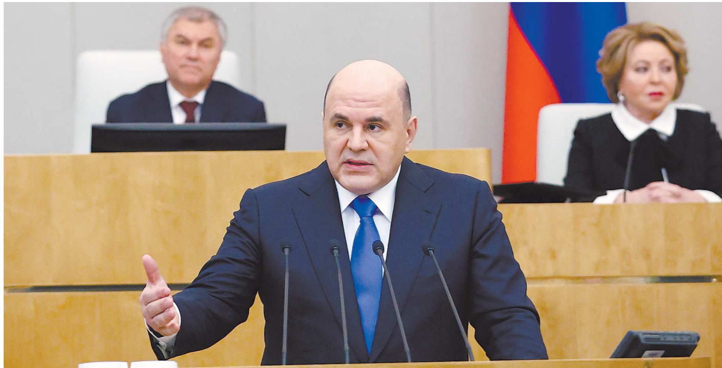
Выступая в Госдуме, Михаил Мишустин заявил, что экономике России нужно полгода на восстановление после введенных санкций

Первый замгубернатора уточнил, что среди компаний с долей иностранного участия есть 84 предприятия, в штате которых насчитывается более 100 работников. Сейчас профильные министерства определяют, насколько критичным оказалось экономическое состояние этих компаний, чтобы оказать им необходимую поддержку.