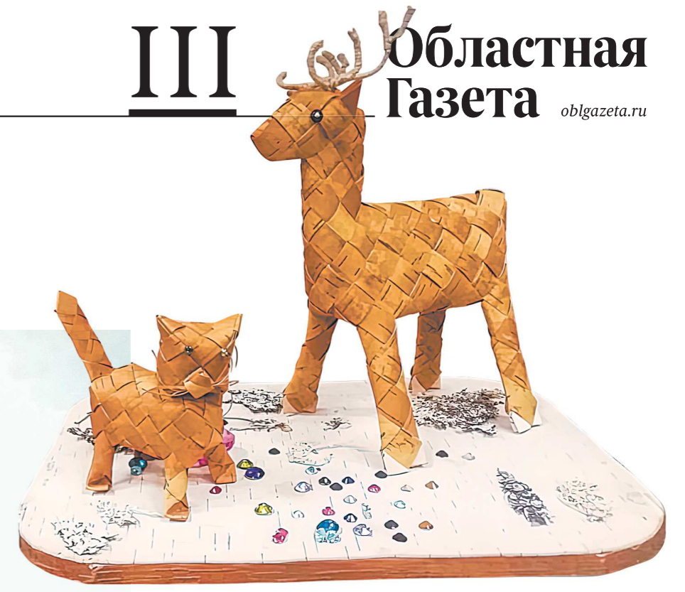
В апреле в музее откроется выставка работ семьи Варовых по художественной обработке бересты