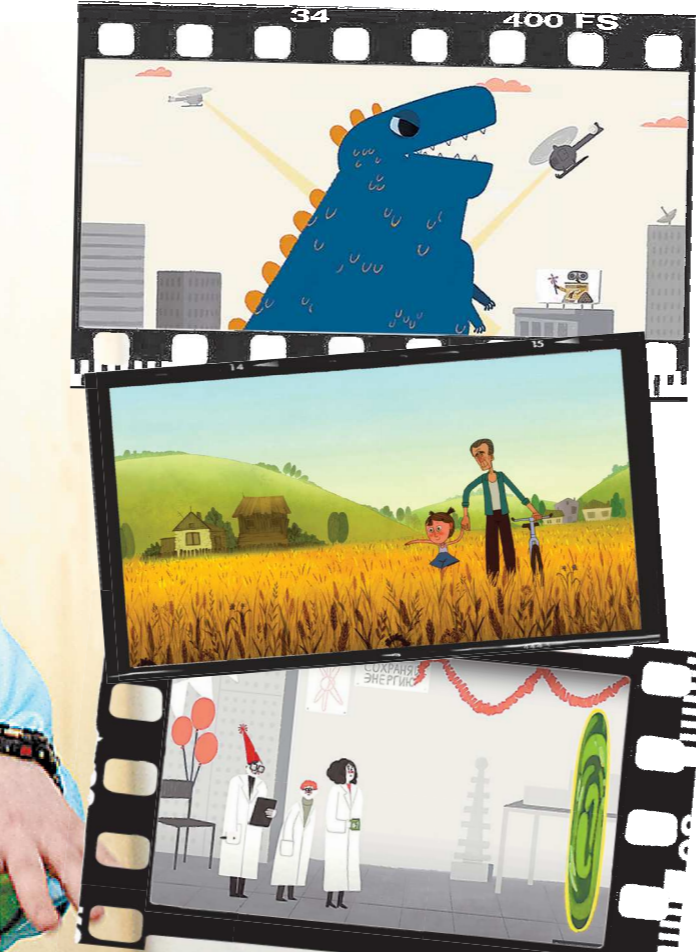
Студия «Светлые истории»

Приз Суздальского фестиваля в категории «Лучшая работа в прикладной анимации», «Левый» (2022).