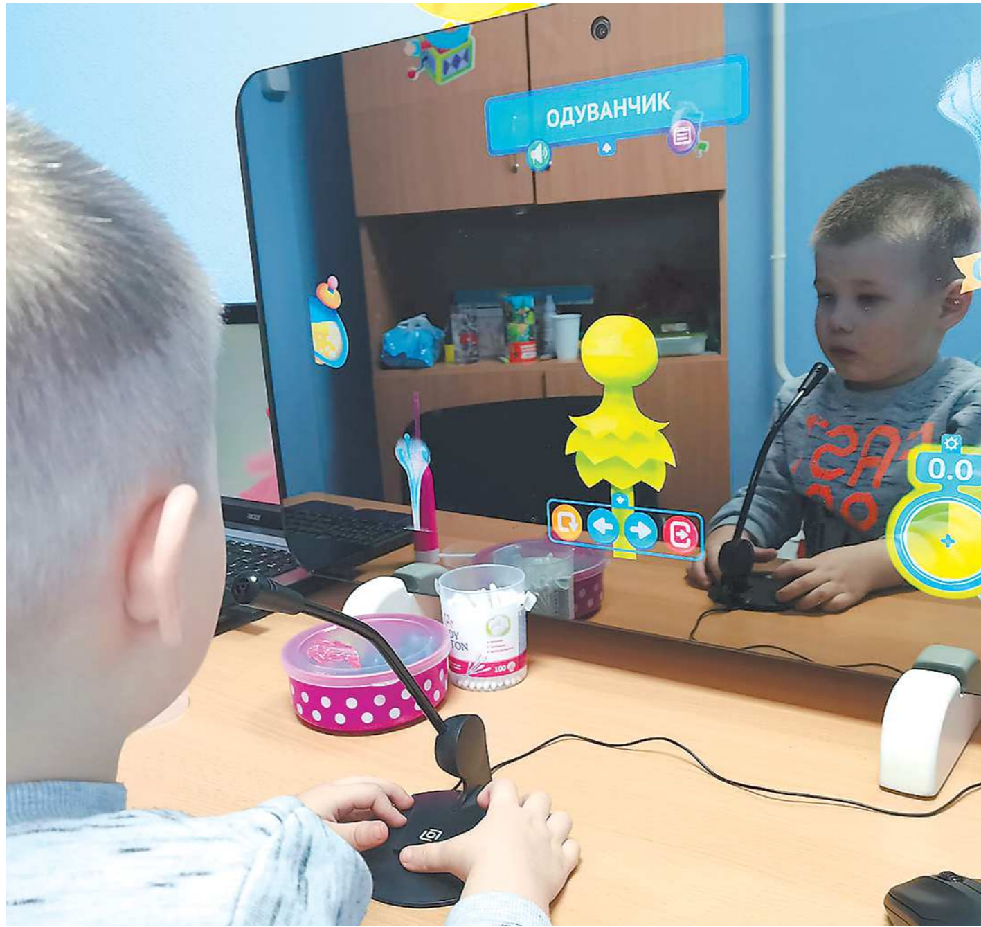
«Умное» зеркало помогает ребенку правильно произносить слова

Весь первоначальный капитал Елена вложила в покупку «умного» зеркала. Это специальное устройство для исправления речи у детей. В зеркале ребенок видит свое отражение и сказочных персонажей. Они дают ему задания. Они дают ему задания по выполнению. Такие задания помогают малышам быстро и правильно загово-