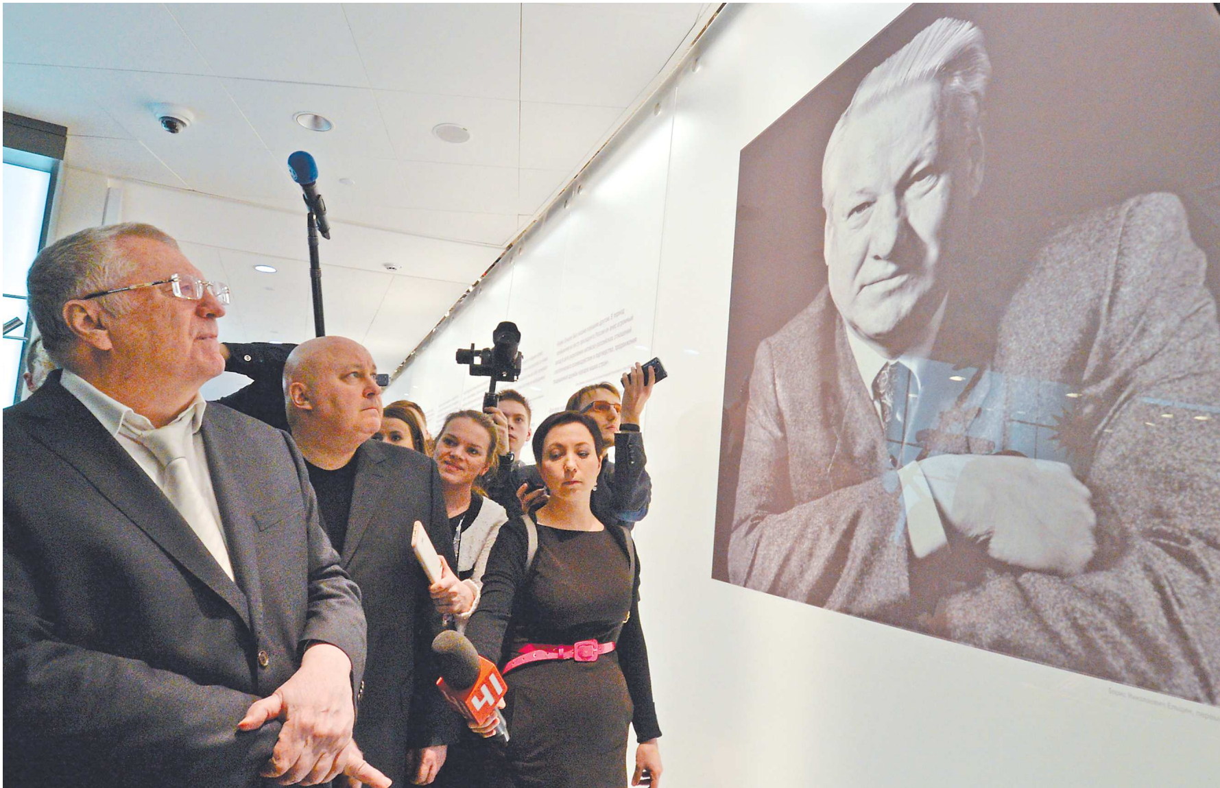
Владимир Жириновский дважды был соперником Бориса Ельцина на президентских выборах. В 1991 году лидер ЛДПР занял третье место (среди 6 кандидатов), в 1996-м – пятое (среди десяти)

«Ведущие специалисты, врачи до последнего боролись за его жизнь, оказывая всю возможную в этой ситуации медицинскую помощь.