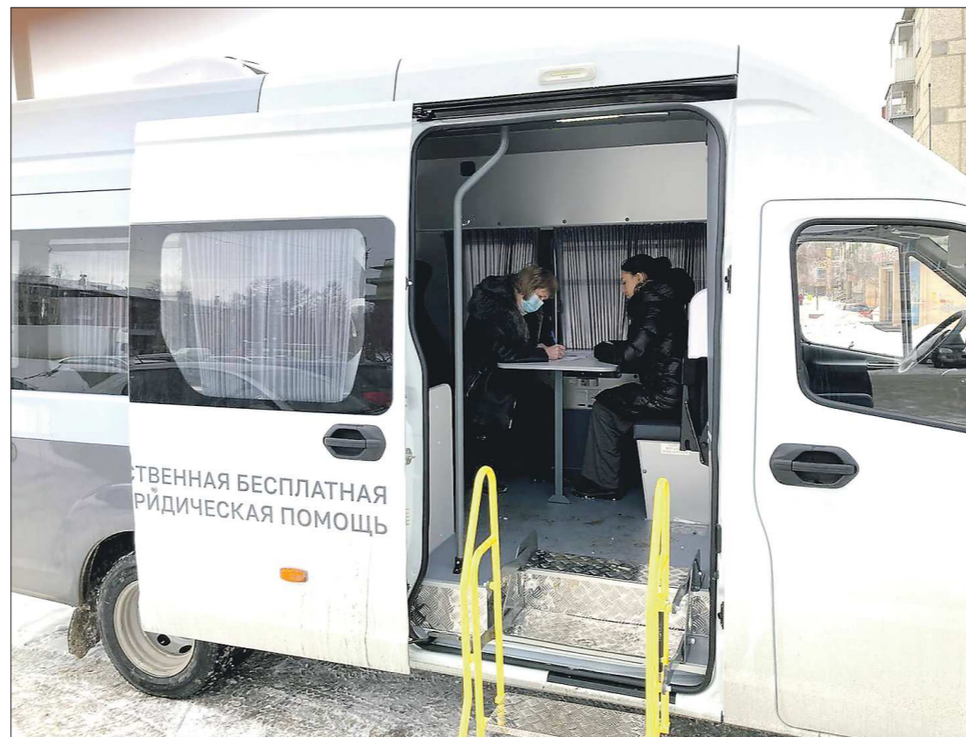
В ПравоМобиле сразу два кабинета юридической помощи

Заявку на получение бесплатной юридической помощи можно подать по телефону: +7 (343) 272 72 77.