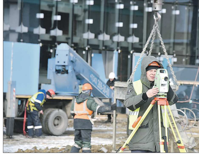
Идёт монтаж фасада Дворца водных видов спорта