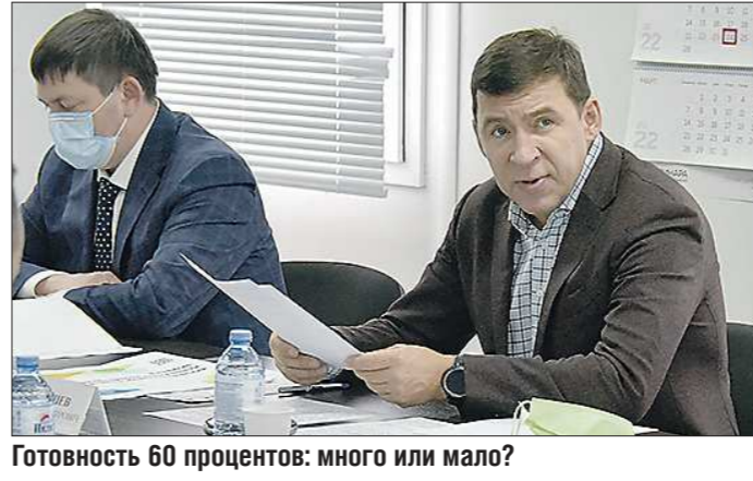
Готовность 60 процентов: много или мало?