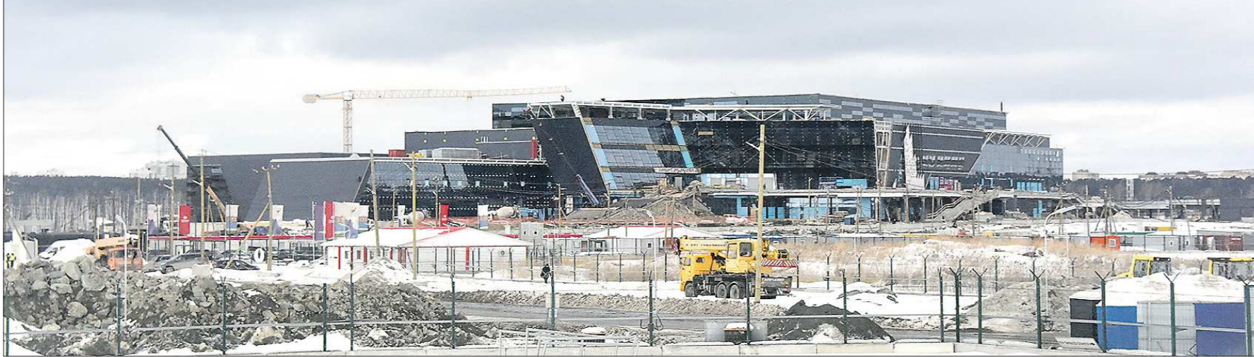
Будущий Дворец водных видов спорта

В самом Выставочном центре «Екатеринбург-