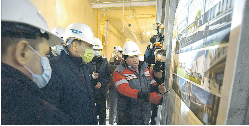
Кампус университета начнётся с проекта Деревни

ЭКСПО», который станет одним из основных мест проведения спортивных соревнований, реконструируют фасады и IT-инфраструктуру. А также построят зону досмотра — автотранспорта и посетителей.