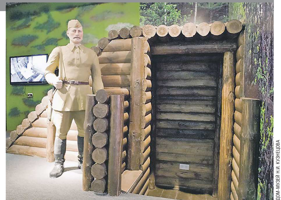
Центральный экспонат музея Н.И. Кузнецова – партизанский бункер, спустившись в который из военной Москвы попадаешь в солдатскую землянку, а выходишь в оккупированном украинском городе Ровно

Николай Кузнецов сам выучил немецкий язык. Известно, что разведчик говорил на шести немецких диалектах. Кроме того, Кузнецов свободно общался на польском и украинском, и знал языки эсперанто и коми