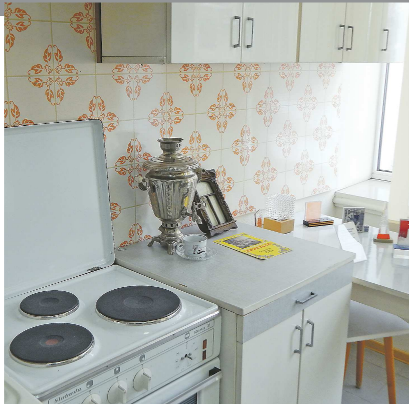
Такие кухонные гарнитуры «Кристалл» выпускали на Уралмашзаводе