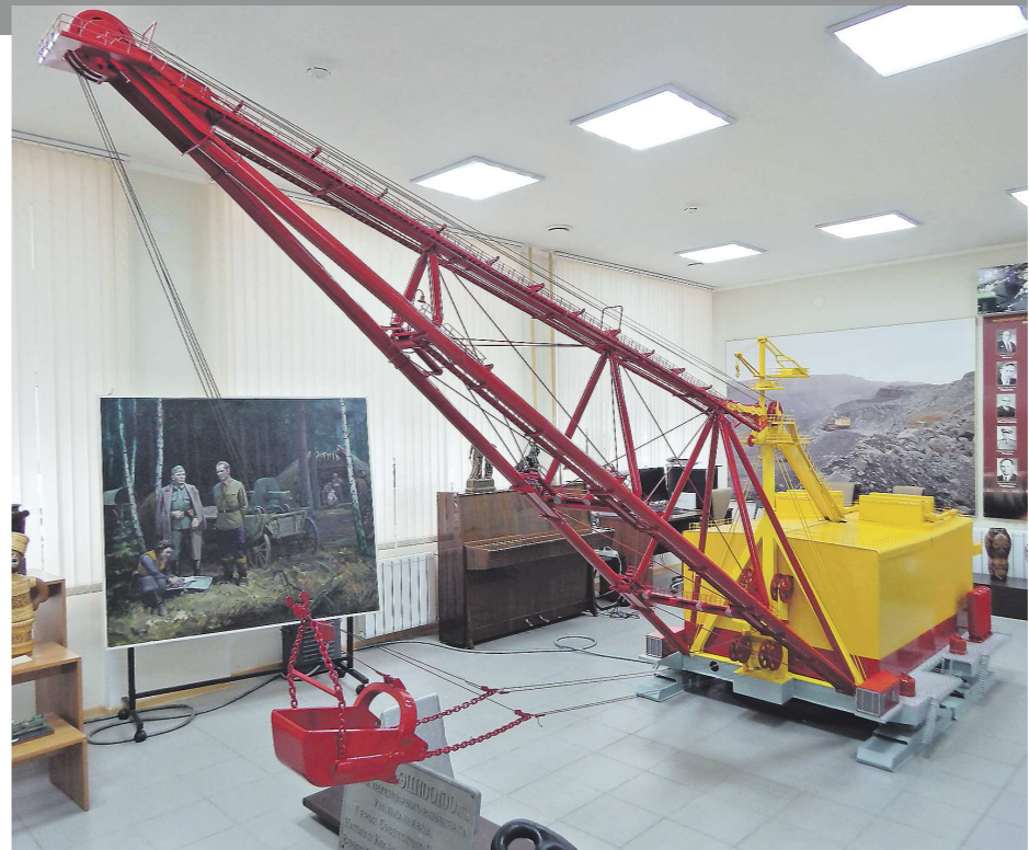
Самый мощный советский шагающий экскаватор ЗШ 100.100 с ковшем объёмом 100 куб.м и стрелой длиной 100 м