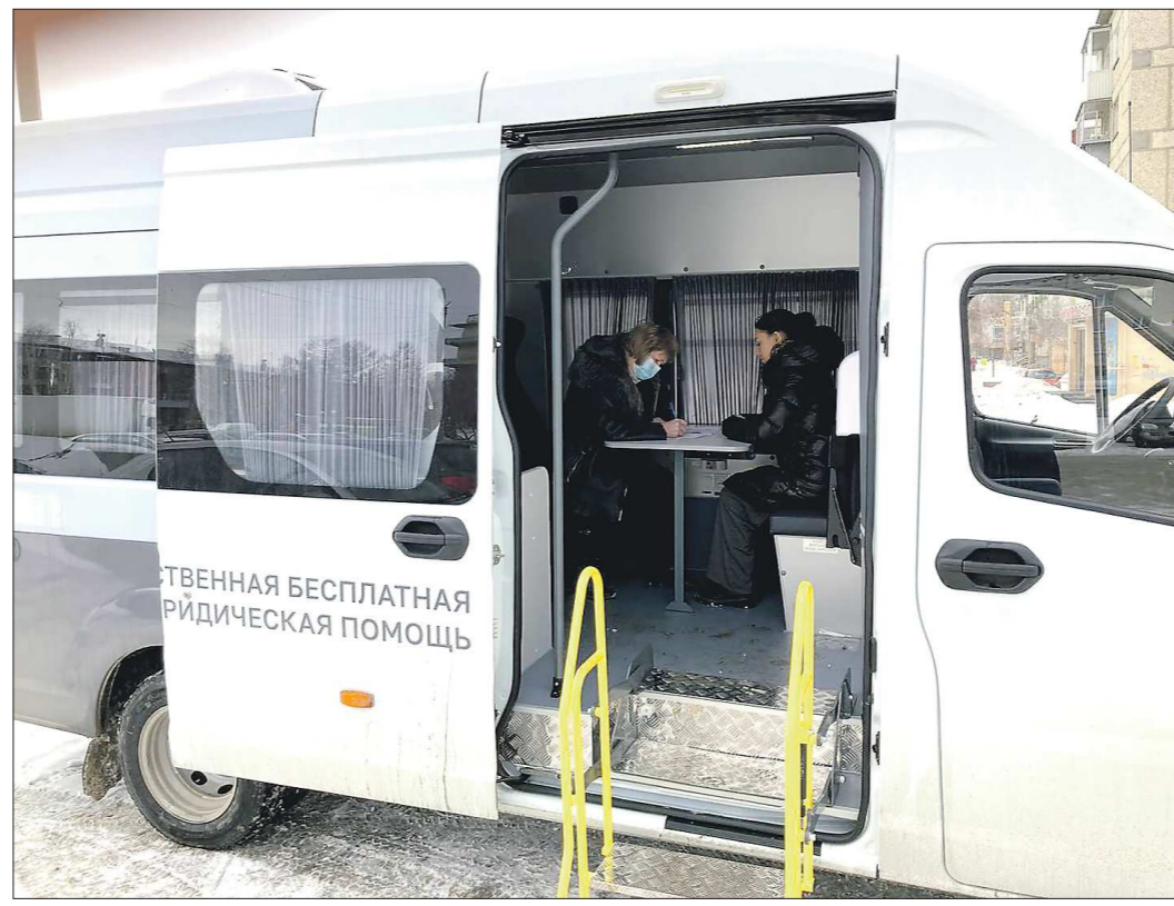
В ПравоМобиле сразу два кабинета юридической помощи

Заявку на получение бесплатной юридической помощи можно подать по телефону: +7 (343) 272 72 77.