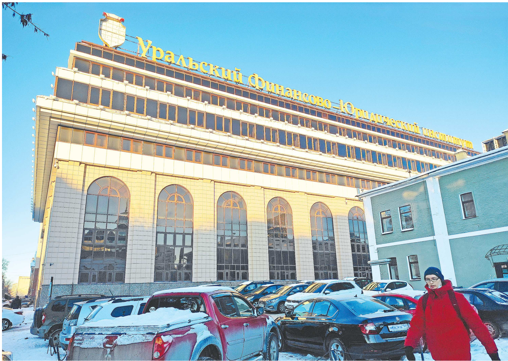
От Уральского финансово-юридического института осталось только название

Вывод для себя сделала: мои дети будут учиться только в государственном вузе, –