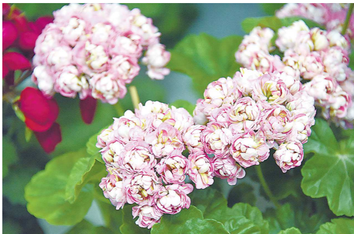
Розебудные пеларгонии имеют густомахровые цветки, похожие на розы. Но, в отличие от классических сортов, у этого гибрида бутоны не раскрываются до конца

Размножается пеларгония преимущественно черенками. Черенковать можно круглый год, но все же лучшее время для вегетативного размножения – это март – апрель и август – сентябрь. Укорененные в конце лета и успешно перезимовавшие