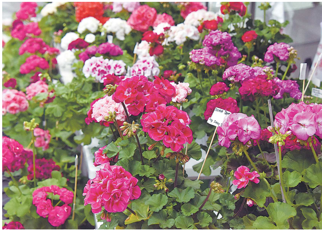
Опытные цветоводы при виде разнообразия сортов пеларгонии шутят, что надо рядом продавать таблетки от жадности и побольше-побольше

Герань и пеларгония не скрещиваются между собой, поскольку относятся к разным родам: Geranium и Pelargonium . Герань – это многолетний травянистый кустарник с резными листьями и россыпью цветков, на каждом из которых насчитывается 5–8 симметрично расположенных лепестков. Цветки могут быть одиночными или собранными в соцветия. Популярны сорта белых, розовых, сиреневых и малиновых оттенков, встречаются также черные. А вот алых цветков у садовой герани не бывает. Выращивают такой цветок на улице, он прекрасно зимует в суровых условиях Среднего Урала. Герань сохраняет свою декоративность и украшает участок до конца осени. Пеларгония – многолетнее травянистое растение. Листья у нее пальчатые, то есть жилки листа расходятся лучеобразно. Цветки неправильной формы: верхние лепестки чуть крупнее нижних. Цветет пеларгония аккуратными пышными соцветиями белых, розовых, алых или темно-красных оттенков. А