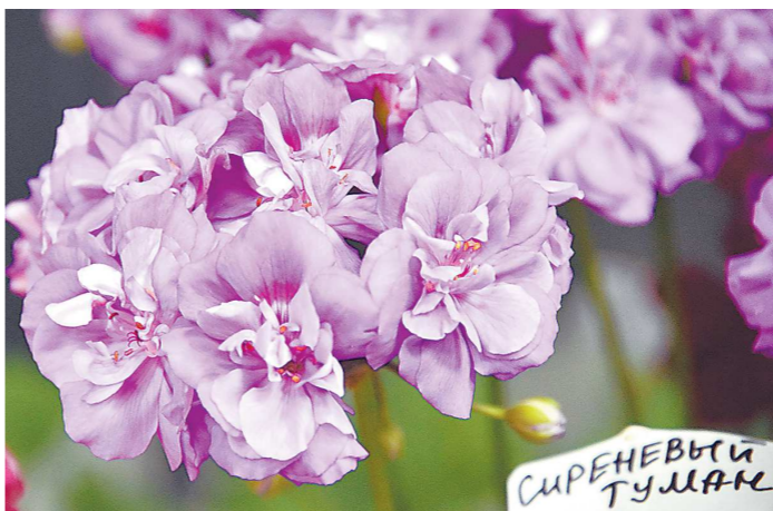
Цветы сорта Сиреневый туман имеют редкую окраску, близкую к фиолетовому цвету

черенки к началу сезона наберутся сил и будут радовать пышным цветением. Это позволит избавиться от старых кустов. Да, пеларгонии стареют, и достаточно быстро. Коллекционеры советуют не держать один куст более 3–4 лет, цветение уже не будет таким пышным, сами соцветия будут мельчать. Поэтому необходимо обновлять посадочный материал регулярно. К тому же сейчас этот цветок набирает популярность.