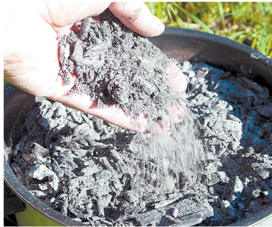
В одной чайной ложке содержится 2 г золы, в стакане примерно 100 граммов, а в литровой банке полкилограмма ценного удобрения