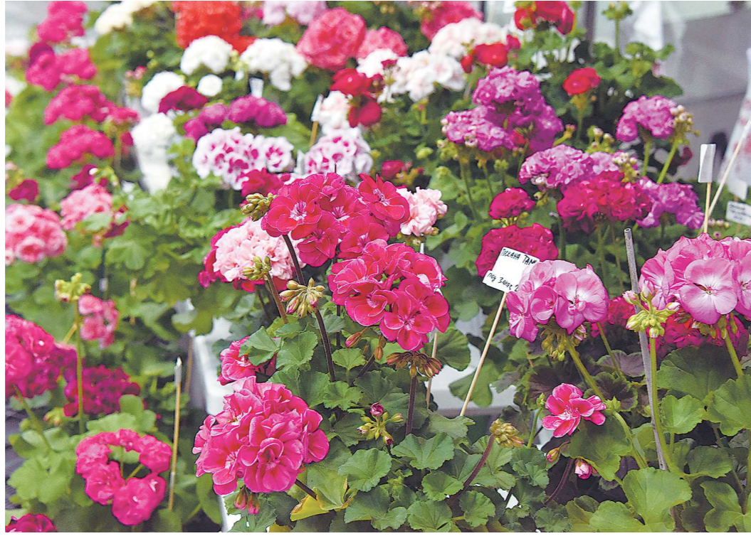
Опытные цветоводы при виде разнообразия сортов пеларгонии шутят, что надо рядом продавать таблетки от жадности и побольше-побольше

Пеларгония – многолетнее травянистое растение. Листья у нее пальчатые, то есть жилки листа расходятся лучеобразно. Цветки неправильной формы: верхние лепестки чуть крупнее нижних. Цветет пеларгония аккуратными пышными соцветиями белых, розовых, алых или темно-красных оттенков. А