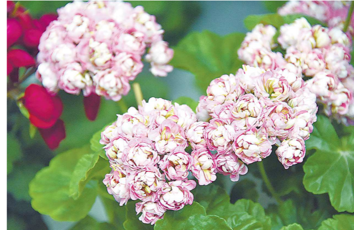
Розебудные пеларгонии имеют густомахровые цветки, похожие на розы. Но, в отличие от классических сортов, у этого гибрида бутоны не раскрываются до конца

Размножается пеларгония преимущественно черенками. Черенковать можно круглый год, но все же лучшее время для вегетативного размножения – это март – апрель и август – сентябрь. Укорененные в конце лета и успешно перезимовавшие