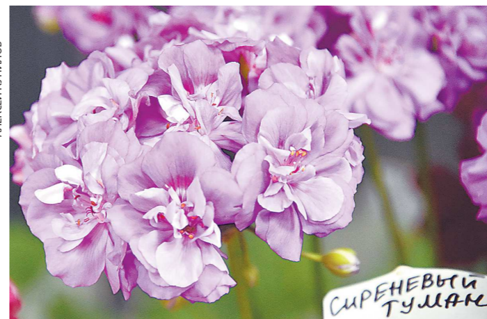
Цветы сорта Сиреневый туман имеют редкую окраску, близкую к фиолетовому цвету

черенки к началу сезона наберутся сил и будут радовать пышным цветением.