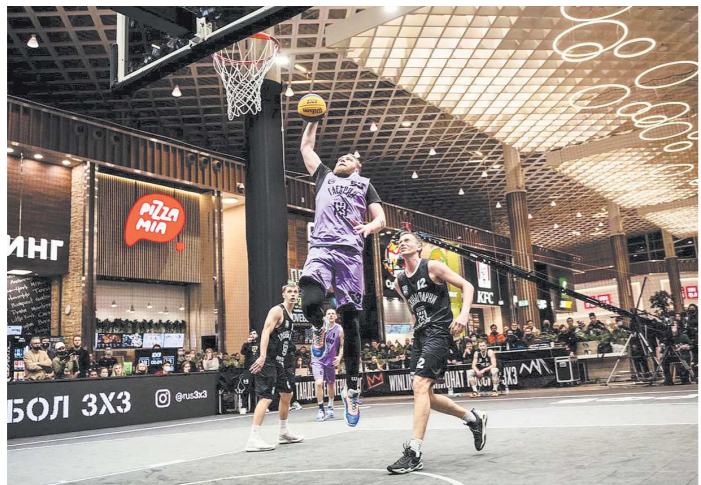
Так проходят матчи баскетбола 3x3 в торговых центрах