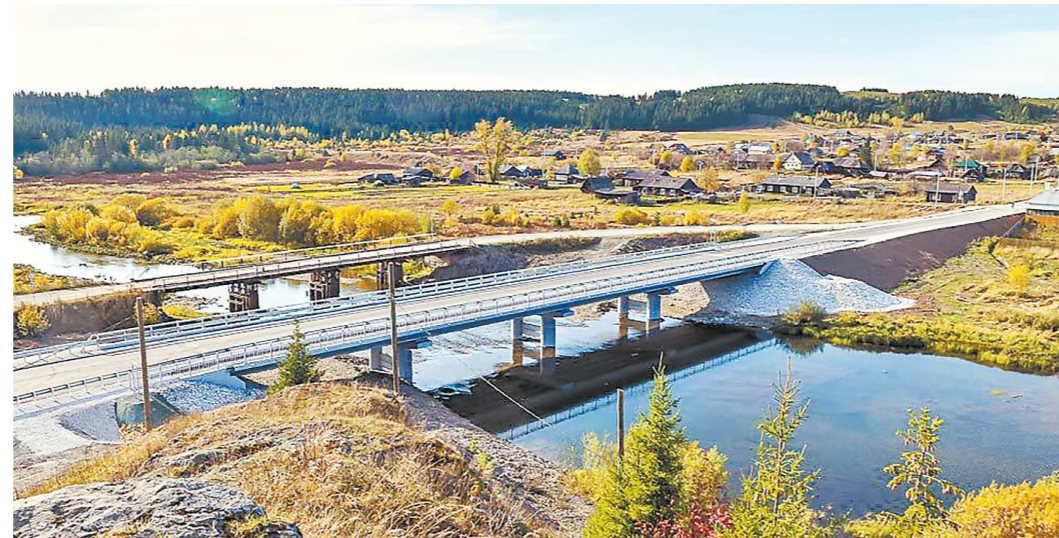
Строить новый мост начали осенью прошлого года

По многочисленным просьбам жителей Серебрянки проект строительства нового моста – уже в капитальном исполнении – мэрия Нижнего Тагила включила в комплексный план развития сельских населенных пунктов. В этом году