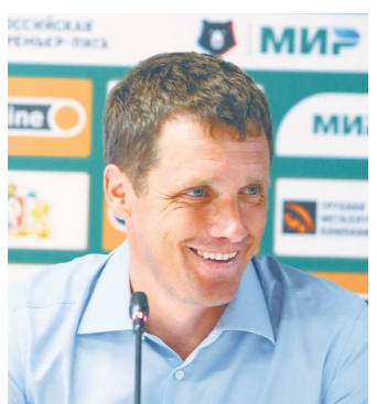
Виктор Гончаренко, помимо «Урала», тренировал еще четыре команды РПЛ

Всего девять тренеров имеют в своем активе по 100 и более побед в отечественной Премьер-лиге. Восемь из них – россияне и один (Гончаренко) – белорус. Лидерами списка являются три тренера, которые в нынешнем сезоне не работают с клубами РПЛ. Это Леонид Слуцкий (209 побед), Курбан Бердыев (189) и Юрий Семин (148). Идействующий специалист в «Клуб 100», кроме Гончаренко, входит всего два наставника: ростовчанин Валерий Карпин занимает четвертое ме-