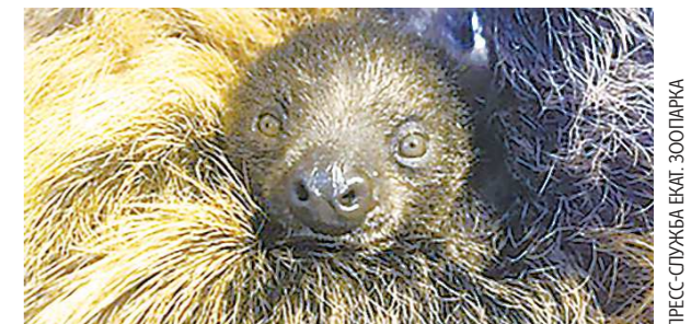
Новорожденный ленивец в объятиях заботливой мамы

Двурульные ленивцы из зоопарка Екатеринбурга в очередной раз стали родителями.