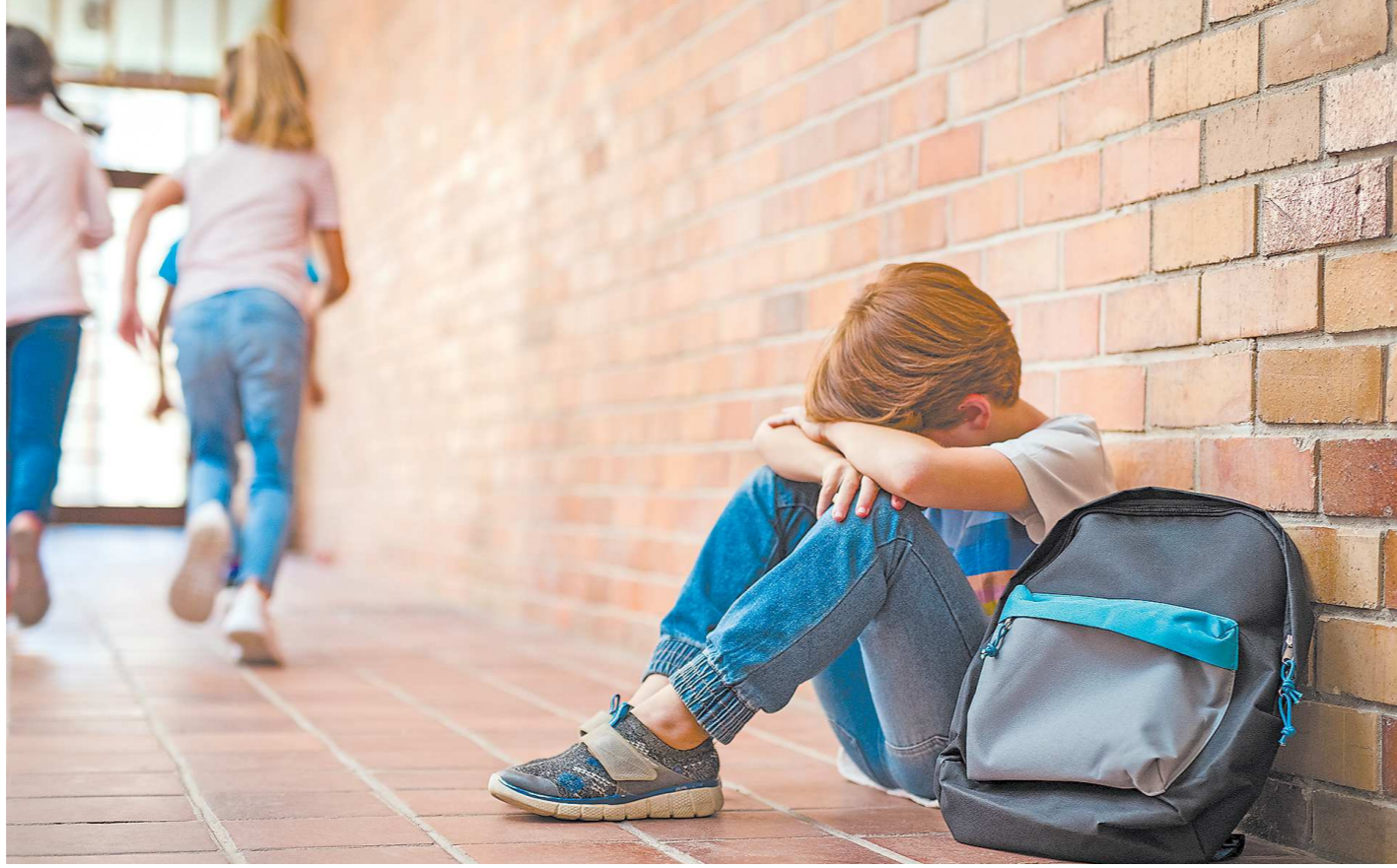
Законопроект направлен на формирование, прежде всего, действенных инструментов профилактики травли, а не на наказание за ее организацию или участие в ней