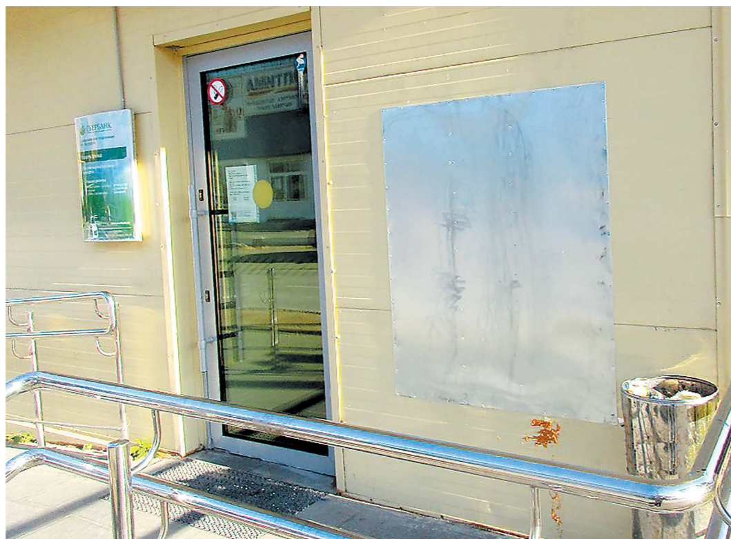
В октябре на главном фасаде здания в Рефтинском демонтировали уличный банкомат. Сейчас исчез и логотип

«Это отделение нам просто необходимо. Поселок разросся, расстояние от домов частного сектора до отделения по улице Гагарина составляет без малого три километра. При неравном пассажирском транспорте закрытие офиса —