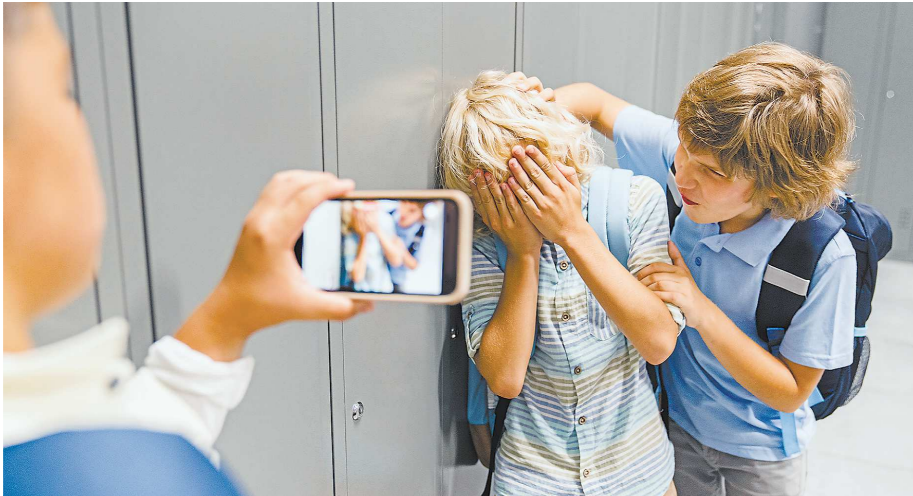
В последние годы увеличивается число родителей с детьми, которые обращаются по вопросам буллинга. Ежегодно оно возрастает на 10-15 процентов

«Это прежде всего рамочный законопроект – мы создаем основу, чтобы потом запустить в стране комплексную программу профилактики травли», – объясняет де-