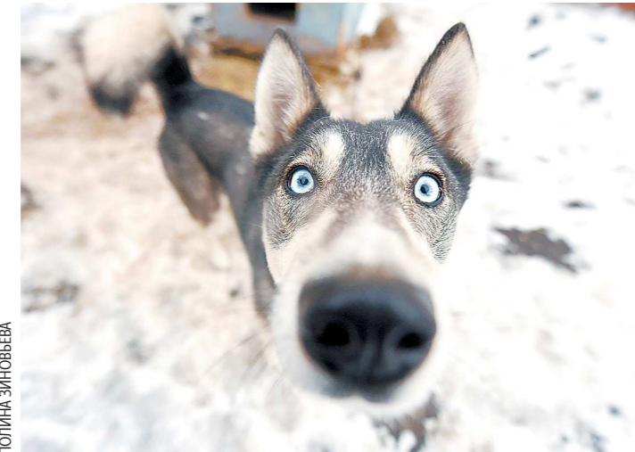
Хаски Вега около двух лет. Она может стать хорошим другом для активных людей или охранныей в частном доме

Елизавета пояснила, раньше пристроим всех по- допечных занимались со- трудники и волонтеры, на это время животные остава- лись в ЦРЖ. Но за последние годы поиск дома для кошки или собаки увеличился до нескольких лет. В центре это связывают с пандемией и нынешней ситуацией в ми- ре и считают, что люди боят- ся брать на себя ответствен- ность за чью-то жизнь и бес- покоятся, что не смогут фи- нансово ее обеспечить.