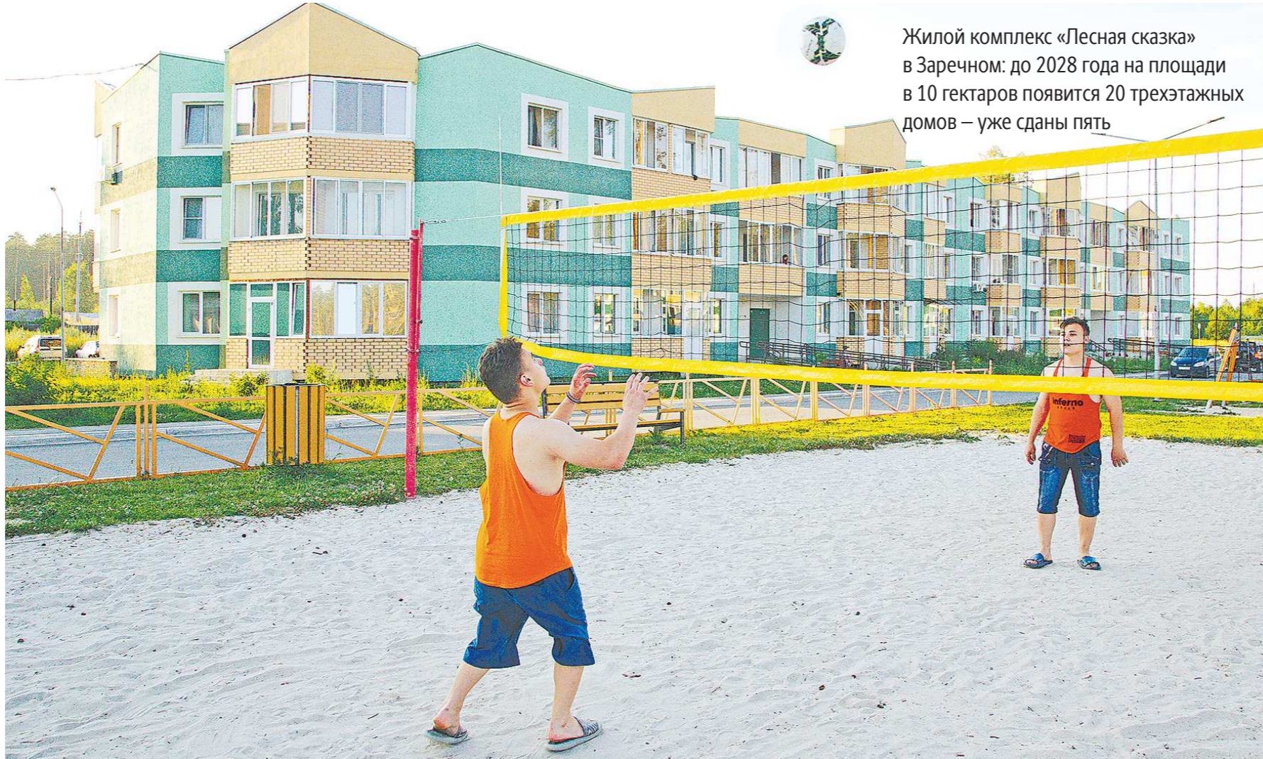
Жилой комплекс «Лесная сказка» в Заречном: до 2028 года на площади в 10 гектаров появится 20 трехэтажных домов – уже сданы пять

Микрорайон Южный в Каменске-Уральском вырос на бывших угодьях Бродовского совхоза. Во время сдачи первых домов он был не очень заманчивым местом для проживания: были проблемы с инфраструктурой. Старожилы вспоминают, как в газетных объявлениях по обмену и покупке жилья люди делали приписку «Южный не предлагать». Сегодня Южный – один из крупнейших в регионе примеров комплексного освоения территории. В микрорайоне живет больше 25 тысяч человек, и он продолжает расширяться. Большая часть жителей – молодые семьи с детьми. Там предоставляют жилье молодым специалистам, сотрудникам градообразующих предприятий, переселенцам из ветхих и аварийных домов. – Жилье строят частные инвесторы. Городу это в плюс, поскольку дает возможность реализовывать масштабные программы, активно развивать востребованные территории, привлекая в том числе региональную и федеральную поддержку, – отмечает глава Каменска-Уральского Алексей Герасимов . Новые социальные объекты и общественные пространства в последние несколько лет сдаются активно. Стро-