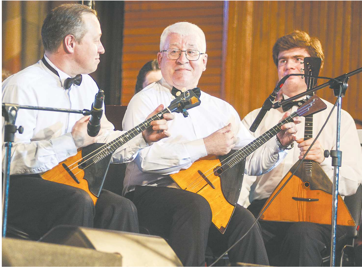
Для профессионалов на форуме – разговор о музыкальном строе народных инструментов (ведь и струны надо уметь натягивать правильно), а для зрителей – удовольствие просто услышать балалайку

На форуме, в его теоретической части, и нынче будет обсуждаться целый комплекс вопросов: творческое лидерство, мастерство, репертуар. Вечные темы. Но показательно название научного диалога – «Роль национального оркестра в современном мире». Национальное искусство – национальное самосознание. События последнего времени обостряют эту параллель. Никто специально этого не задумывал. Совпало. Назрело. Человек устает от безвременья, без ощущения корней. Ему все-таки необходимо крепко стоять на земле, чувствовать