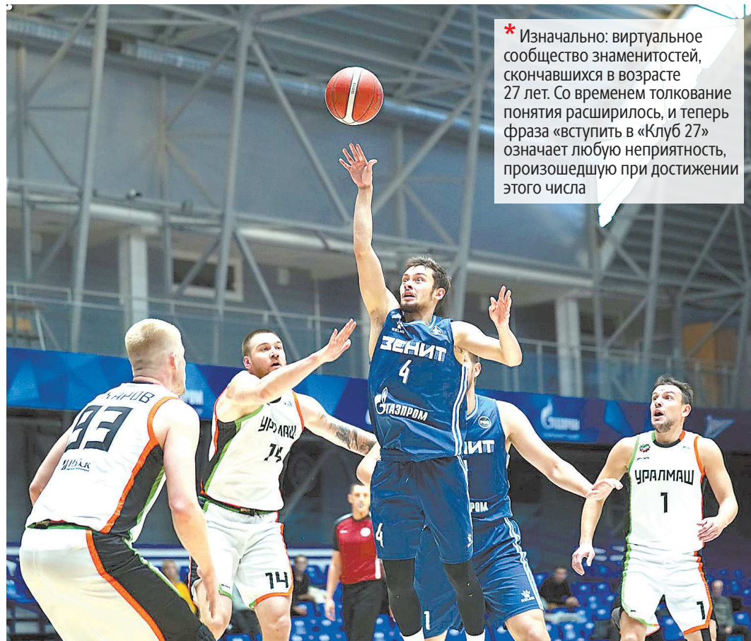
Питерцы бросали по кольцу гораздо реже, чем «Уралмаш» (51:69), но зато намного точнее: 67 процентов попаданий против 46 процентов у гостей. Это и стало главной причиной успеха хозяев