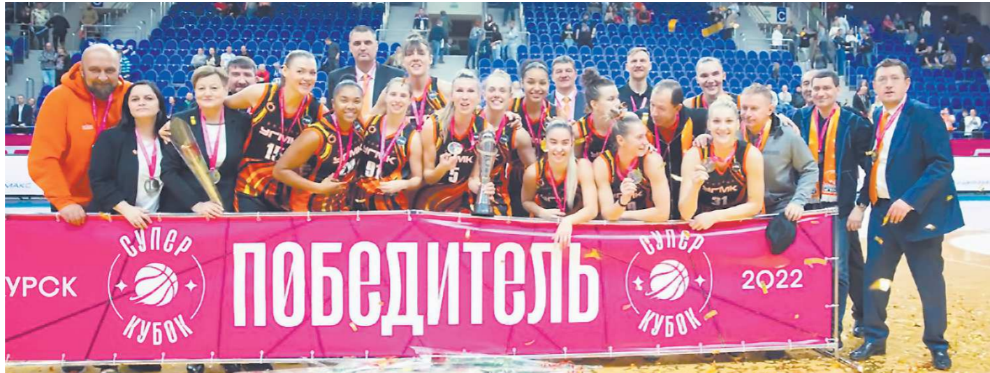
«Лисицы» выиграли Суперкубок России второй раз подряд

В прошлом баскетбольном сезоне оба женских турнира России выиграло курское «Динамо». Сначала (в декабре 2021 года) оно завоевало Кубок, в финальном матче одолев сыктывкарскую «Никку» (65:61), а весной 2022-го перервало суперсерию БК «УГМК», который стал чемпионом страны 13 раз подряд. Золотую серию «Динамо» выиграло со счетом 3:1. Это первая победа в национальном чемпионате в истории курской команды.