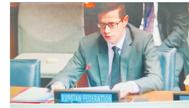
СЕРИОЗНО ТРАНСЛЯЦИИ ЗАСЕДАНИЯ «ВСЕ БУДЕТ»

Жителей Артемовского взволновало выступление их земляка на Генассамблее ООН. Как сообщают «Егоршинские вести», в редакцию позвонила читательница газеты, которая 26 октября увидела по телевизору трансляцию заседания совещательного форума.