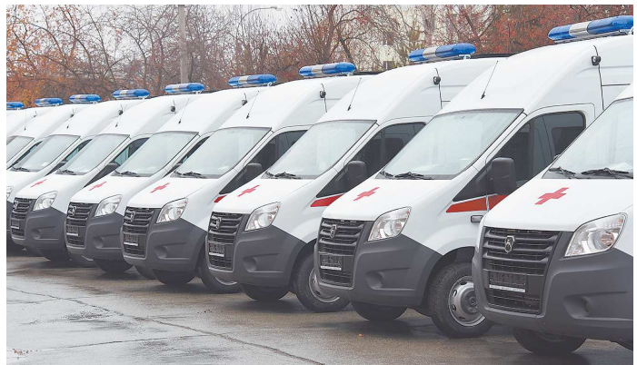
28 автомобилей скорой медицинской помощи распределили между 23 больницами региона