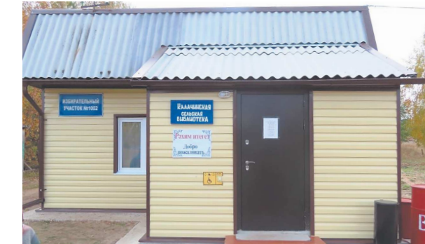
КАЛАЧИКСКАЯ СЕЛЬСКАЯ БИБЛИОТЕКА

В деревне Калачики капитально отремонтировали единственную в Тугулымском районе татарскую библиотеку.