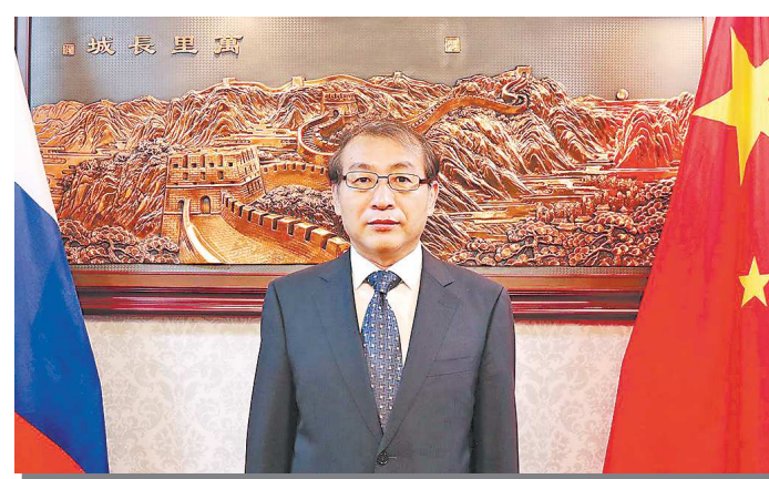
ГЕНЕРАЛЬНОЕ СЕКРЕТАРСТВО ЦК КПК В БИЖИАНГЕ. Р.

С 16 по 22 октября в Китае с успехом проводился 20-й съезд КПК. Генеральный секретарь ЦК КПК Си Цзиньпин заявил, что с нынешнего момента центральная задача КПК – спланировать и вести за собой многонациональный народ страны к осуществлению намеченной к столетию КНР цели полного построения модернизированной социалистической державы, во всестороннем продвижении дела великого возрождения китайской нации путем китайской модернизации.