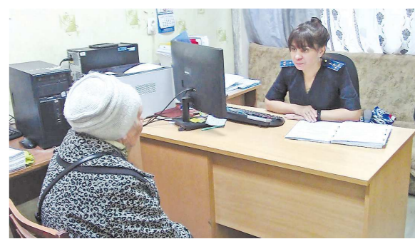
ПРЕСС-СЛУЖБА ГУ МВД РФ ПО СО

88-летняя женщина возвращалась домой из магазина, на сидящего на лавочке у подъезда незнакомца понемногу не обратила внимания. Однако, когда он вслед за ней направился в сторону подъезда, бдительная бабушка поинтересовалась, в какую ему нужно квартиру. В ответ на это преступник толкнул пенсионерку в подъезд, а когда она закричала – навалился ей на лицо шапку и зажал рот рукой. В итоге его добычей стали тысячная купюра, ключи от квартиры потерпевшей и сотовая трубка – самый простой и дешевый «бабушковод». Со всем этим грабитель выбежал наружу, а пенсионерку в шоковом состоянии обнаружили в подъезде соседи. От всего случившегося ей стало плохо, пришлось вызывать не только полицию, но и скорую.