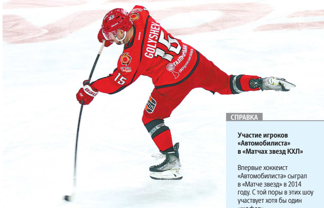
За 10 сезонов в КХЛ форвард, получивший прозвище Толя-Гол, забросил 114 шайб

И тот, и другой уже принимали участие в «Матчах