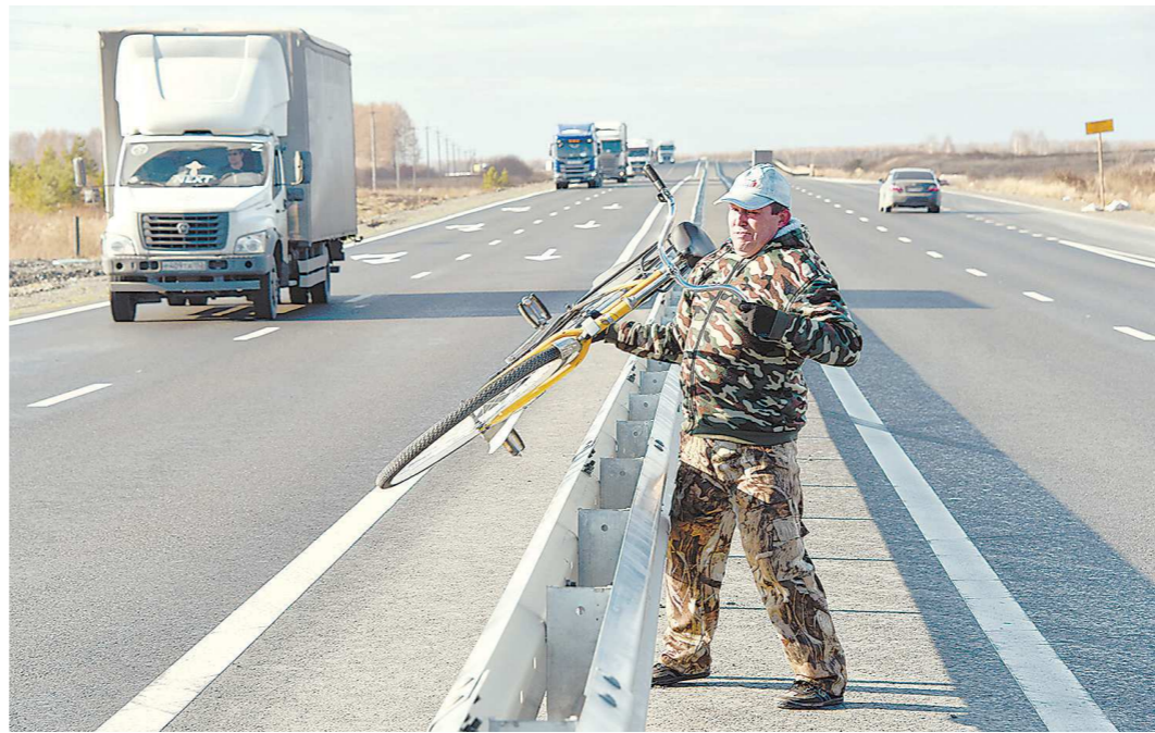
Раньше из Бора в Яр частенько ездили на велосипеде, но сейчас это проблематично

На 196-м километре трассы расположена деревня Бор, в ней живет 280 человек. Вся деревенская инфраструктура – это небольшой магазин, где можно купить хлеб и молоко, придорожное кафе и дом-интернат для престарелых и инвалидов. За продуктами, на почту, в больницу надо идти через дорогу, в село Яр. Там же находится школа и детский сад.