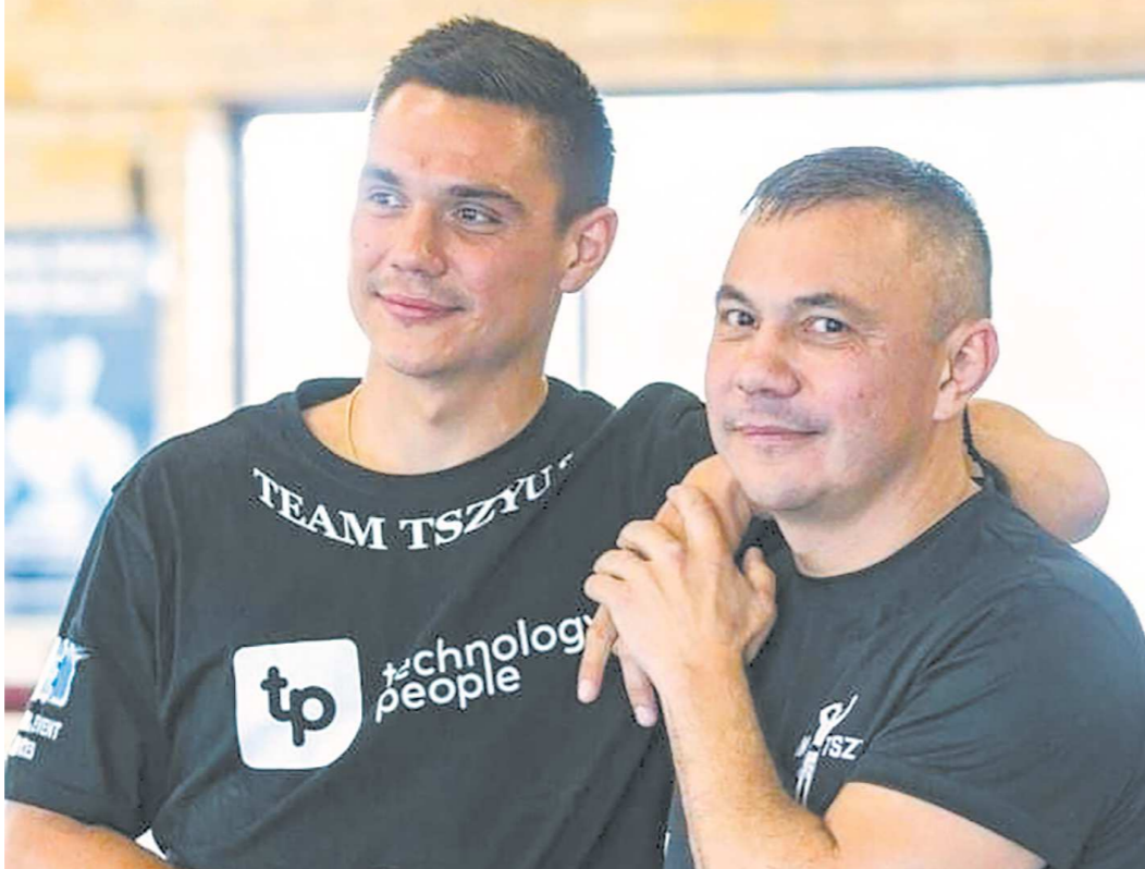
«На бой Тимофея за звание абсолютного чемпиона мира обязательно поеду. Хотел бы поддержать за чемпионский пояс сына», – говорит Костя Цзю (на снимке – слева)

В Серове стартовал традиционный турнир по боксу среди юношей – Кубок Константина Цзю. Участие в соревнованиях принимают спортсмены не только из Свердловской области, но и со всего Уральского федерального округа. На церемонию открытия турнира, как всегда, приехал его основатель – легендарный свердловский боксер, уроженец Серова, абсолютный чемпион мира Костя Цзю.