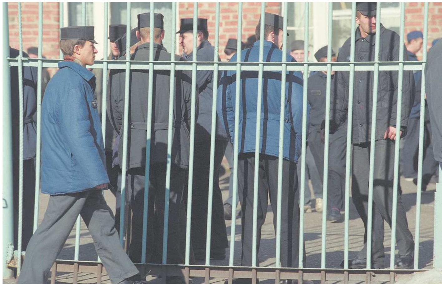
У заключенных появится еще одна возможность выйти на свободу