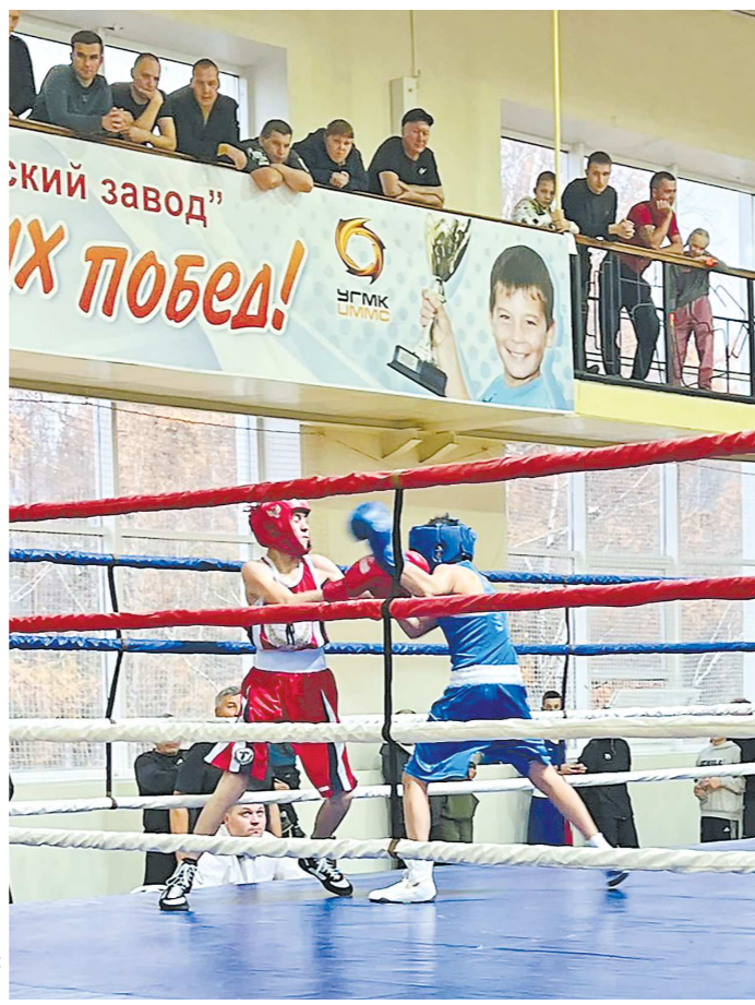
В турнире выступают боксеры трех возрастных групп: старшие юноши (2007-2008 г.р.), средние юноши (2009-2010 г.р.) и юниоры (2005-2006 г.р.)