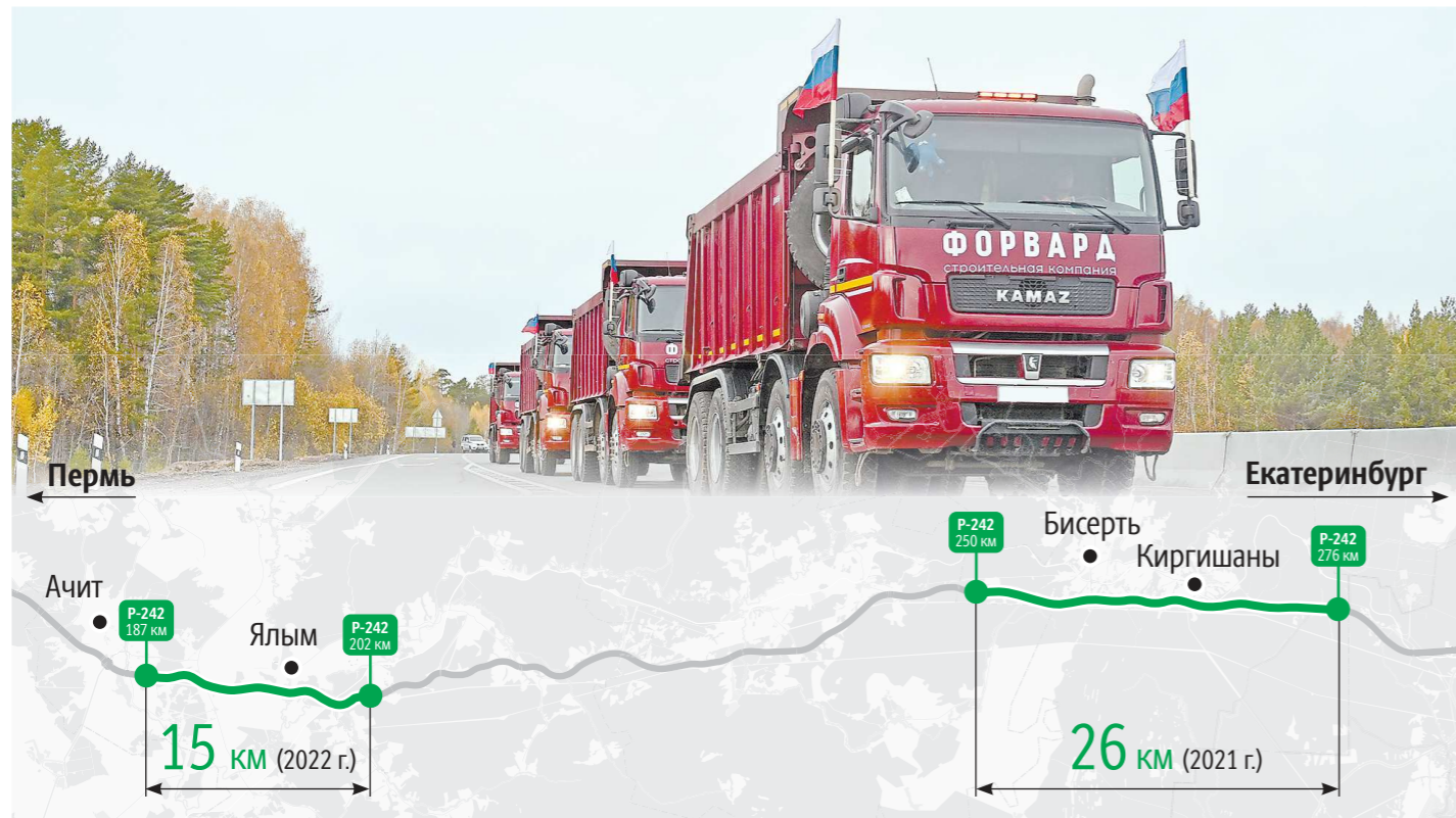
Скоростной режим на отремонтированном участке автодороги Пермь–Екатеринбург останется прежним (90 км/час)