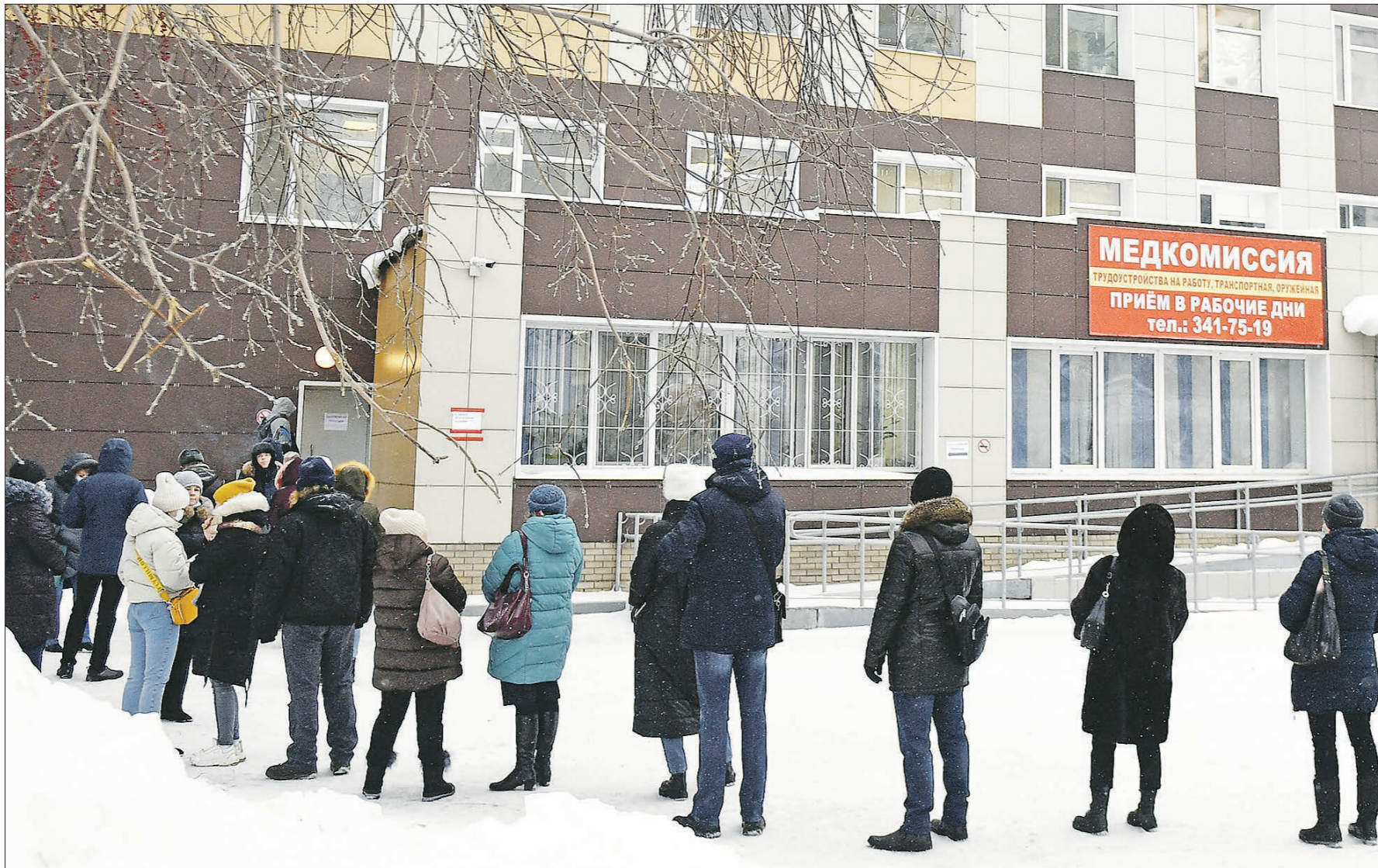
Очередь в поликлинику №1 Центральной городской больницы №7 в Екатеринбурге

– Система здравоохранения снова перегружена, мы не можем резко увеличить количество врачей – у нас и так уже работают студенты. Заболевших ОРВИ и коронавирусом я прошу всё-таки дожидаться медика из поликлиники, если болезнь протекает не в критической форме, и оформить электронный больничный на сайте Фонда социального страхования – r66.fss.ru . Это легко. В пандемию мы все научились жить в Интернете. Уверен, что если мы перенесём туда и этот процесс, очереди в поликлиниках резко сократятся, и ни-