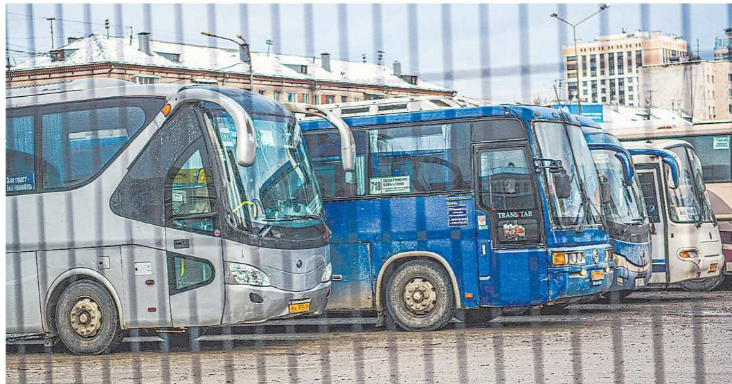
Автовокзал оказался заложником пандемии: из-за критического падения объемов пассажирских перевозок в условиях пандемии доходы упали

Как выяснила «Областная», до 2018 года автовокзал находился в собственности акционерного общества «УК ПТП». Организация обанкротилась, были объявлены торги. В итоге здание ушло с молотка за 24,5 миллиона рублей. Новым