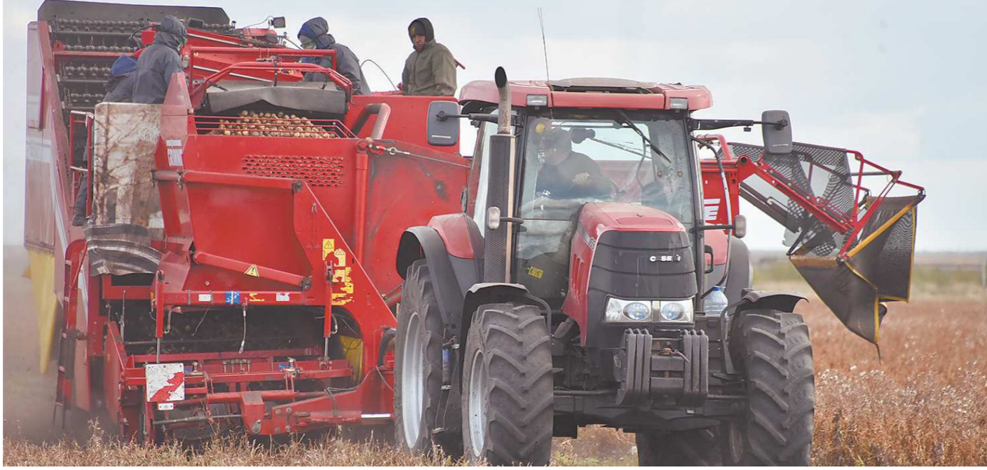
В Свердловской области убрали около половины от запланированной нормы картофеля