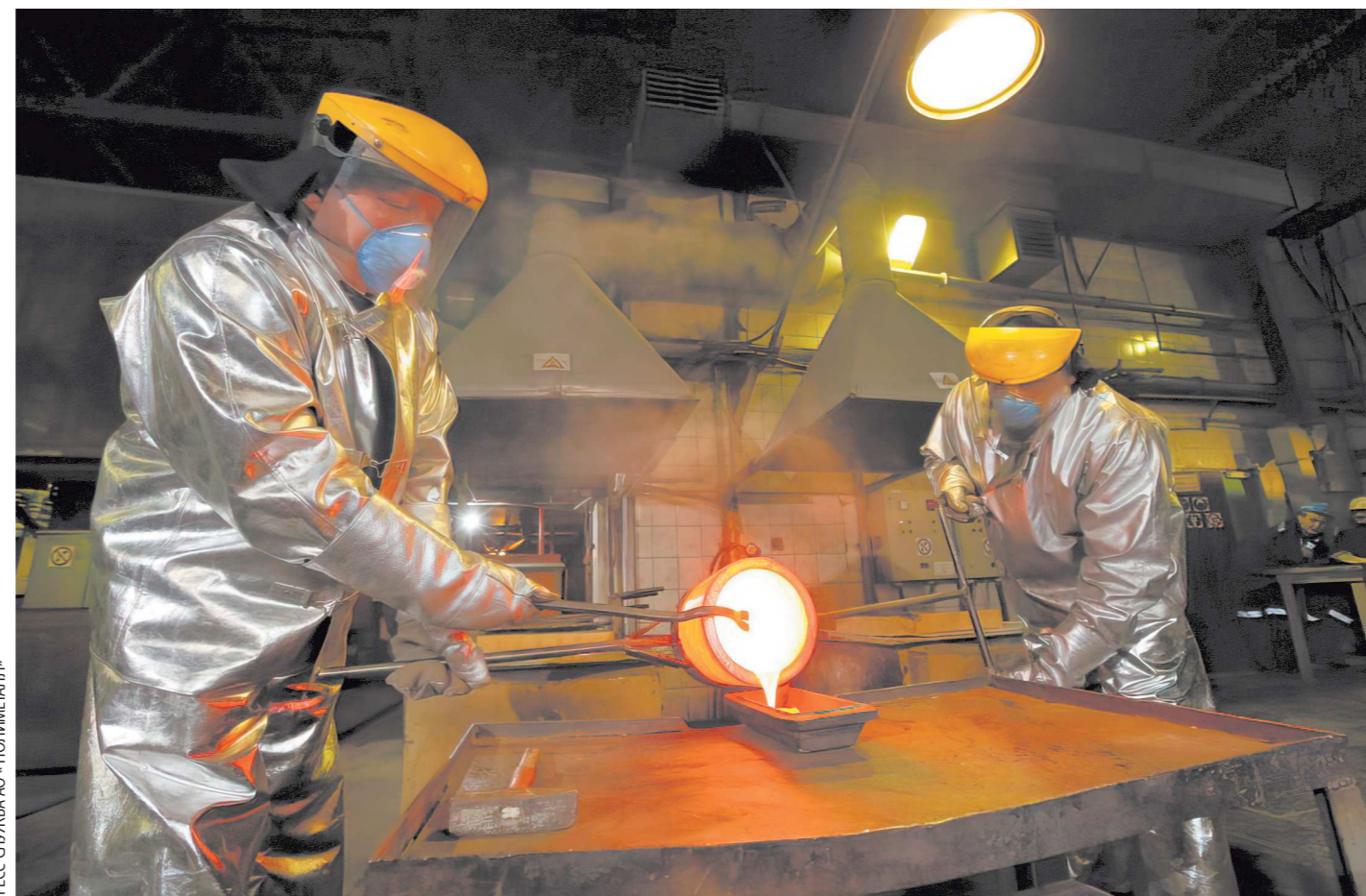
Выплавка сплава доре из золота и серебра весом 8 кг и стоимостью 40 млн рублей на промышленной площадке компании «Золото Северного Урала» — резидента ТЭСЭР в Красноуральске

Недавно в ТЭСЭР Лесного зашли еще три компании — «Атомгазсервис», «НПК ЭСК» (научно-производственный комплекс «Энергетические системы и компоненты») и «Протон». «Атомгазсервис» готовит к запуску производство оборудования для автотранспортных газонапол-