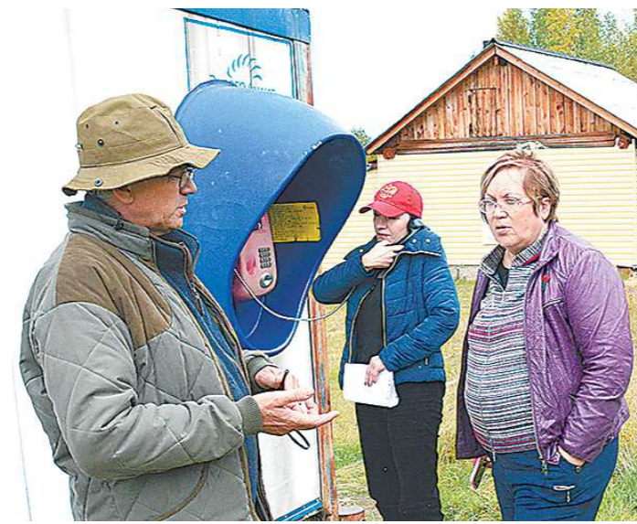
В северных малонаселенных местах области когда-то проблемой было провести телефон. К решению проблемы подключалась омбудсмен...