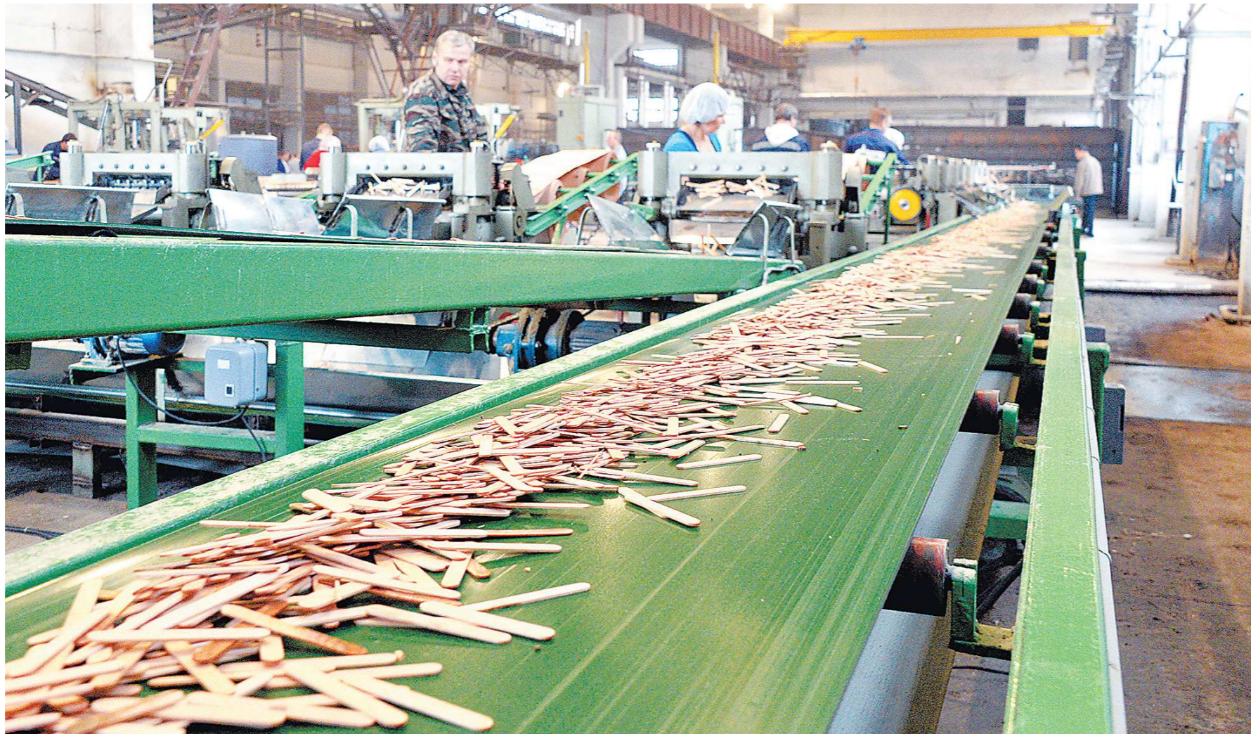
Компания «Лескомразвитие» – резидент ТОСЭР в Красноуральске – является 100-процентным экспортером и входит в состав китайской компании Kingsun Development Co – крупнейшего в мире производителя палочек для мороженого

За последние два месяца Министерство экономического развития РФ приняло два стратегических решения: продлить льготный режим для резидентов ТОСЭР в Красноуральске и Верхней Туре и расширить перечень допустимых видов деятельности для резидентов ТОСЭР в Новоуральске и Лесном. В ведомстве считают, что нововведения будут стимулировать развитие бизнеса и способствовать укреплению экономики свердловских моногородов. С реальными экономическими результатами резидентов ТОСЭР знакомились корреспонденты «ОГ» Юлия БАБУШКИНА и Ольга БЕЛОУСОВА.