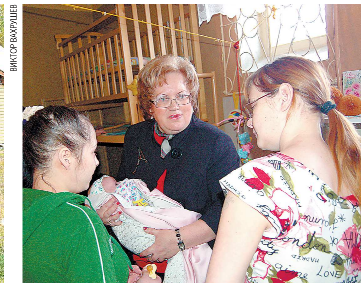
В женском СИЗО № 5. Одна из задач омбудсмена — создать наилучшие условия для мам и детей в условиях изоляции