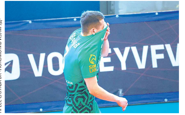
ПРЕСС-СЛУЖБА ФК «ЛОКОМОТИВ-ИЗУМРУД»

В минувший уик-энд стартовал чемпионат России среди команд высшей лиги «А». Екатеринбургский «Локомотив-Изумруд» — бронзовый призер предыдущего розыгрыша — встретился на домашней площадке с «Тюменью». Результаты оказались диаметрально противоположными: в первом матче — победой 3:0, во втором — поражением 0:3.