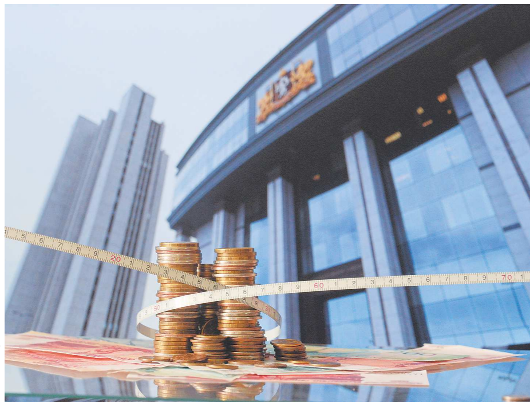
Проект нового регионального бюджета Заксобрание будет рассматривать в трех чтениях, прежде чем утвердить

28 сентября в Минфине завершились согласительные бюджетные процедуры с муниципалитетами. В течение двух недель всех