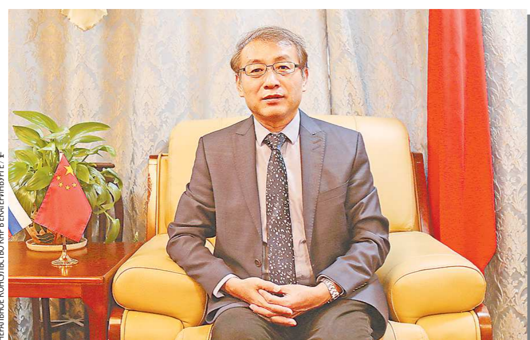
ТЕНЬЕВЫЙ КОМПЬЮТЕР КИТАЙСКОГО ПРЕЗИДЕНТА

За прошедшие 73 года экономическое развитие Китая стало историческим прорывом. Из бедной и отсталой страны Китай превратился во вторую по величине экономику мира, крупнейшую промышленную страну, крупнейшую торговую державу, и страну с крупнейшим валютным резервом. С 2013 по 2021 год среднегодовой рост ВВП Китая составлял 6,67%, что превышало мировой темп роста в 2,6% и 3,7% в развивающихся экономиках за аналогичный период, а уровень вклада в глобальный экономический рост в среднем превышал 30%. За последние 10 лет Китай в мировом экономическом составе составлял 18,5%, что на 7,2% больше, чем в 2012 году. На сегодняшний день Китай – единственная страна в мире, которая обладает всеми промышленными категориями в соответствии с принятой ООН промышленной классификацией, и также с 2010 года уже 12 лет подряд занимает первое в мире место по объему добавленной стоимости обрабатывающей промышленности. Китай занимает лидирующие позиции в мире в таких областях научно-технических инноваций, как аэрокосмическая техника, суперкомпьютеры и сеть 5G, а уровень вклада научно-технического прогресса в экономический рост превышает 60%. В прошлом году китайцы впервые