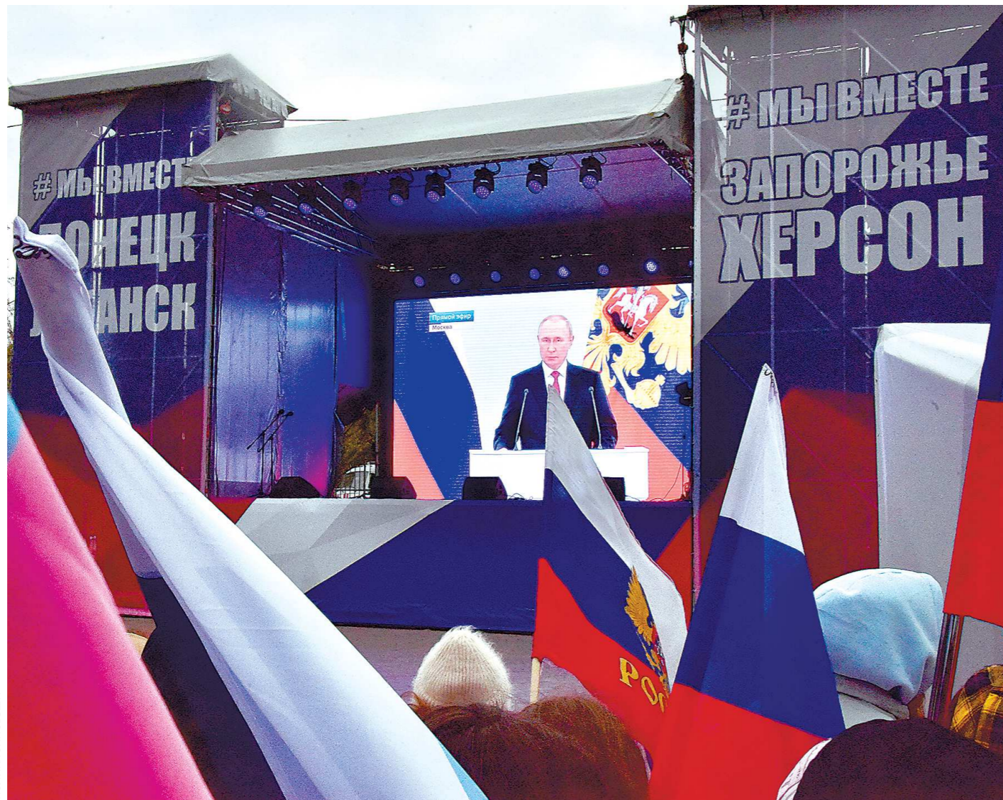
Независимость ЛНР и ДНР была признана Россией в феврале 2022 года, а 29 сентября Владимир Путин подписал Указы о признании суверенитета и независимости Запорожской и Херсонской областей

«Мы с вами становимся участниками историческо-