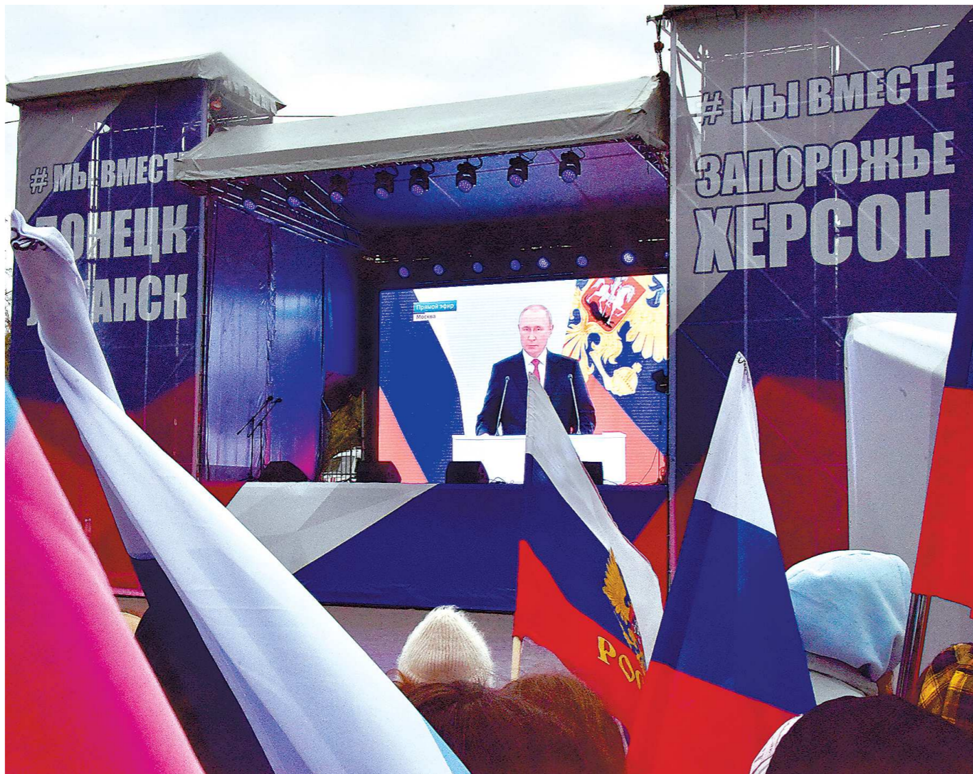
Независимость ЛНР и ДНР была признана Россией в феврале 2022 года, а 29 сентября Владимир Путин подписал Указы о признании суверенитета и независимости Запорожской и Херсонской областей

«Мы с вами становимся участниками историческо-