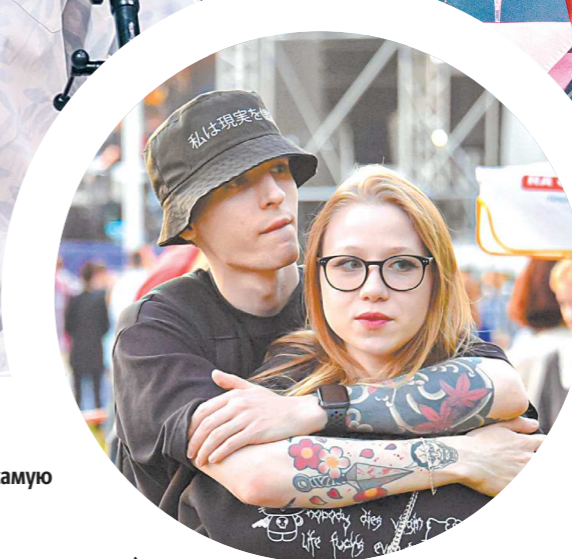
На группу Uta2man в «Гринвиче» пришло столько человек, что далеко не все смогли уместиться. Вероятно, это повод для организаторов в следующий раз отдать им самую большую площадку