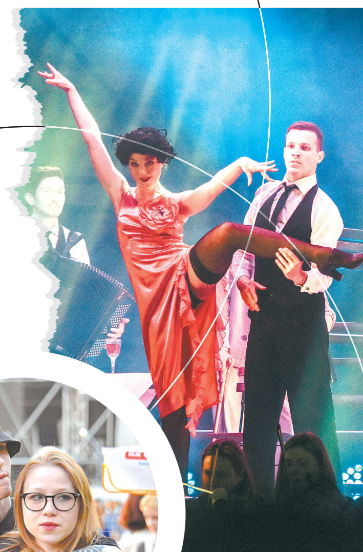
Для всех выпускников (и не только) на площади 1905 года представили мюзикл «Алые паруса» пермского Театра-Театра