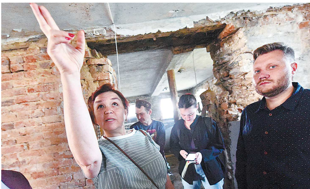
Фундамент усадьбы XIX века отлично сохранился

Попробовать пожить самостоятельно, научиться элементарным вещам, которые для большинства людей привычны, выпускники интернатов могут в тренировочных квартирах. Это один из этапов социализации людей с ментальными нарушениями и ограниченными возможностями здоровья. В Свердловской области сегодня такое жилье уже существует при девяти учреждениях и в двух появится до конца года.