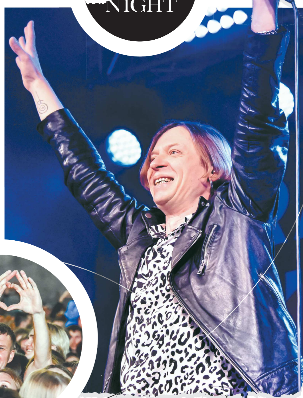
Хедлайнером сцены «Старый Новый рок» стал Найк Борзов. Перед выступлением артист встретился с поклонниками, которые в конкурсе выиграли возможность взять у него автограф и, конечно, сфотографироваться