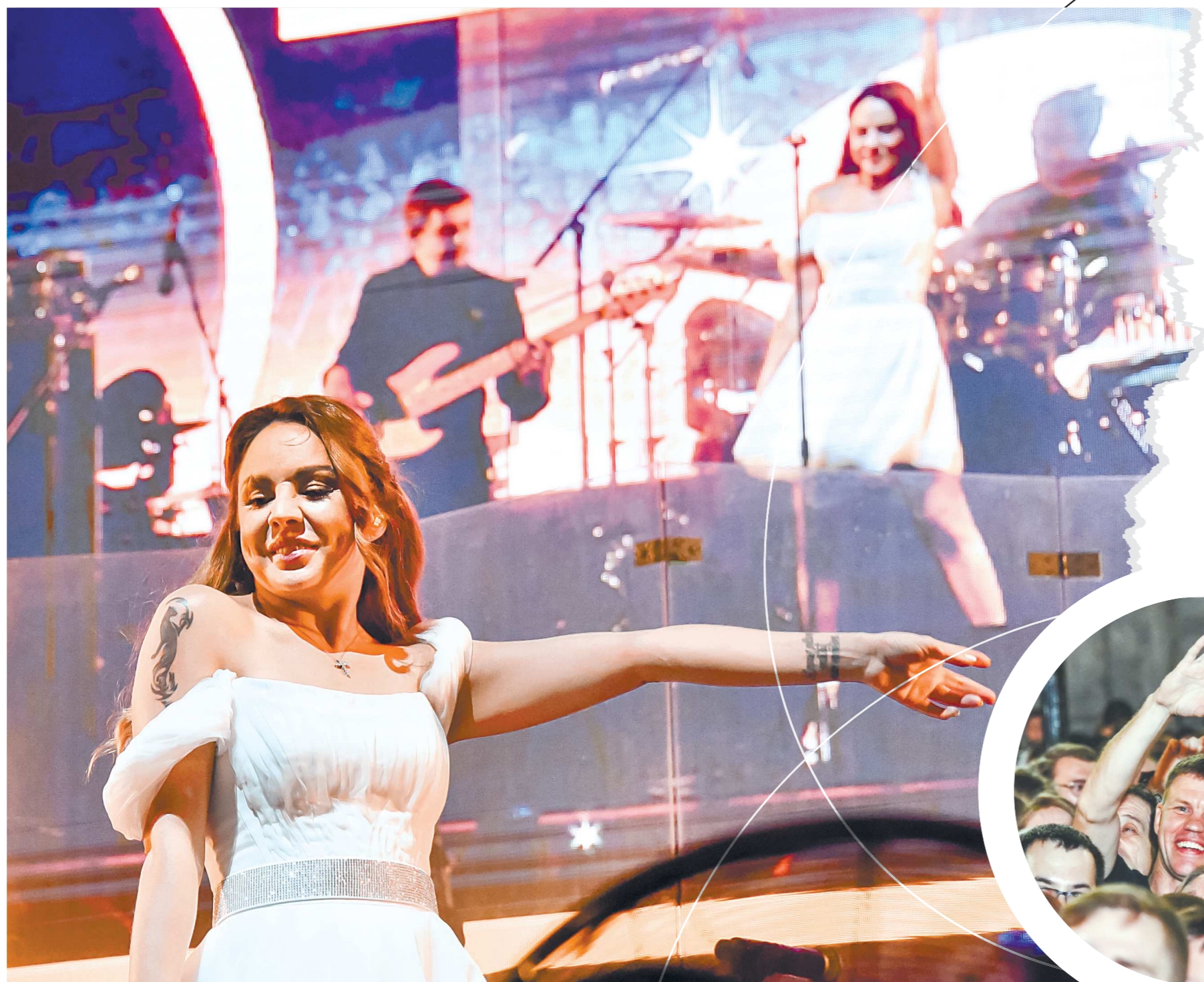
Для певицы МакСим это было одно из первых масштабных выступлений после болезни. И Екатеринбург устроил ей фантастический прием