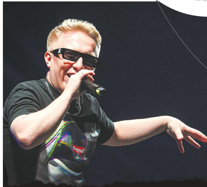
Витя-АК оказался практически единственным артистом, кто несколько раз выходил на бис