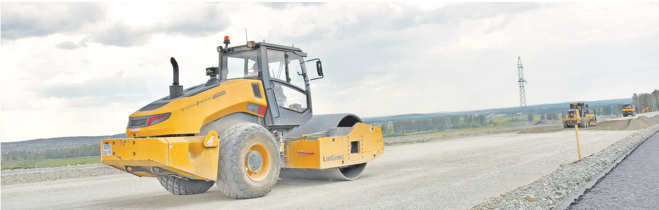
Работы на финальном участке екатеринбургской кольцевой автодороги идут круглогодично

Строительство последнего участка екатеринбургской кольцевой автодороги (ЕКАД) близко к завершению.