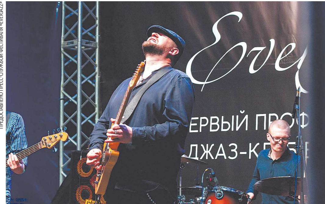
«Blues Doctors» пообещали устроить на фестивале ночь электрического блюза

В этом году на фестивале очень насыщенная этно-программа. Среди хедлайне-