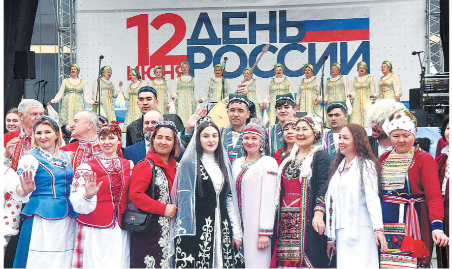
Сводный хор объединил представителей разных народов, проживающих на Урале