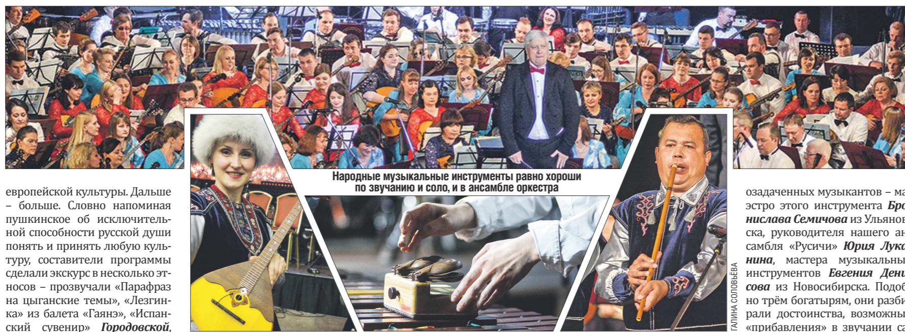
Народные музыкальные инструменты равно хороши по звучанию и соло, и в ансамбле оркестра

Пока – об эмоциях. Риску утверждать: Уральский форум национальных оркестров России, собравший не от хорошей жизни фигурантов и посятителей, если перевести на часы, больше внимания именно проблемам, останетса всё-таки в истории