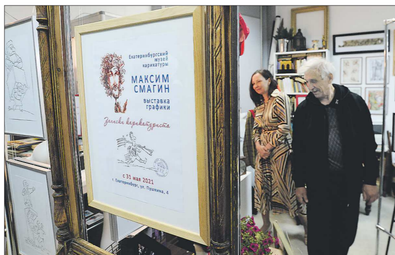
На выставке представлены 55 рисунков юбилея

Подготовлено в соответствии с критериями, утвержденными приказом Департамента информационной политики Свердловской области от 09.01.2018 №1 - Об утверждении критериев отнесения информационных материалов, публикуемых государственными учреждениями Свердловской области, к социально значимой информации.