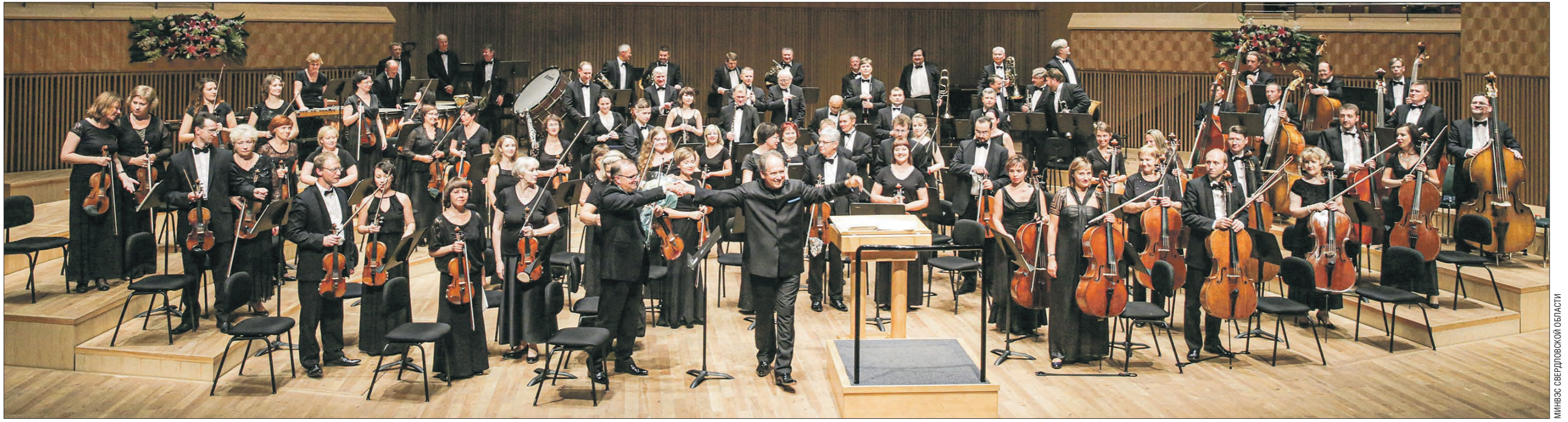
В августе 2016 года в рамках 33-го музыкального фестиваля «Харбинское лето» Уральский академический филармонический оркестр дал концерт в честь 25-летия установления побратимских отношений между Свердловской областью и Харбином