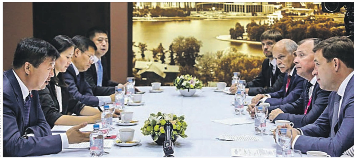
Министр Свердловской области