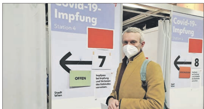
Весь процесс вакцинации в Австрийском конференц-центре занимает около двух часов.

В ноябрьские праздники в российском туризме намечается новая тенденция: десятки тысяч наших граждан отправятся в Европу не за привычным отдыхом в средневековых замках или горных шале, а за тем, чтобы поставить себе иностранную вакцину от коронавируса.