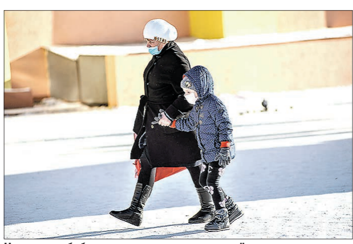
Некоторые бабушки проводят с внуками всё время, пока родители на работе

Дарья ПОПОВИЧ Учёные Уральского федерального университета провели опрос десятков свердловских семей и пришли к выводу, что помощь бабушек и дедушек — практически такой же труд, как официальная работа.