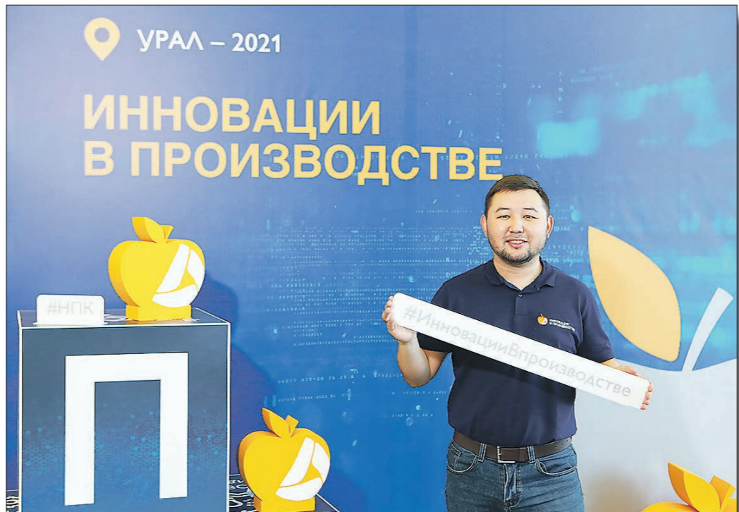
В перерывах участники конференции могли сфотографироваться на память

На конференцию, которая на днях проходила в Екатеринбурге, приехали молодые специалисты из Магаданской области, Хабаровского края, Чукотки и Казахстана.