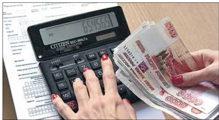
Самую большую долю поступлений в бюджет всех уровней в нашей стране обеспечивают Москва (21 процент от общего объёма налогов), ХМАО-Югра (9 процентов) и Санкт-Петербург (7 процентов)