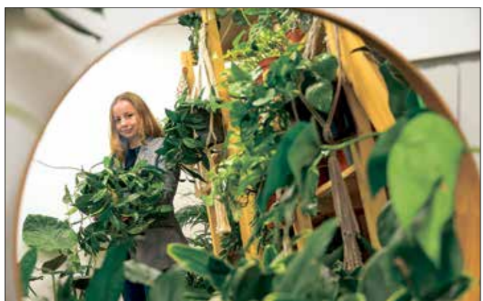
Раньше лианы опасались выращивать дома, но сейчас без этого эффектного растения часто не обходится ни одно озеленение пространства

ваю её досочкой или тарелкой и ставлю сверху две трёхлитровые банки с водой, закрываю холщовым полотном и оставляю всё на сутки при комнатной температуре. Через сутки смотрю: если капуста плохо отдаёт сок, добавляю подсоленной воды (на литр – столовую ложку) и оставляю ещё часа на два. После этого снимаю гнёт и протыкаю капусту палочкой, стараясь её чуть приподнять со дна, не тревожа марлю с ржаной мукой. Проколы периодически повторяю на протяжении 15–16 часов. После этого раскладываю её по банкам и убираю на холод, ржаную муку выкидываю, она нам больше не нужна.