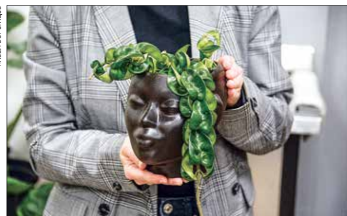
Сегодня выбор разновидностей лиан впечатлит любого цветовода, к примеру, это – хойя Компакта