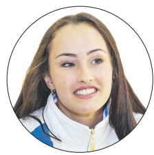
Анастасия ТАТАРЕВА Художественная гимнастика 24 года Золото в многоборье, группы (ОИ-2016)

Сложнее дела обстоят с ванными комнатами. Они, как оказалось, не рассчитаны на высоких людей. Почему проектировщики не задумались об этом – загадка. Такая же