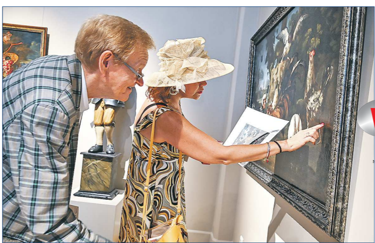
Культурно-просветительский центр «Эрмитаж-Урал»

До 31 октября в центре работает выставка произведений из «Эрмитажа» «От романтизма к импрессионизму», где можно увидеть работы Моне, Дега, Сезанна, Гогена, Ван Гога и других художников, а также постоянные экспозиции — западноевропейское искусство и мемориальная выставка, посвящённая сотрудникам «Эрмитажа» в годы эвакуации. С 15 июля на 3-м этаже центра «Эрмитаж-Урал» начал работу летний лекторий, посвящённый европейскому искусству разных эпох.