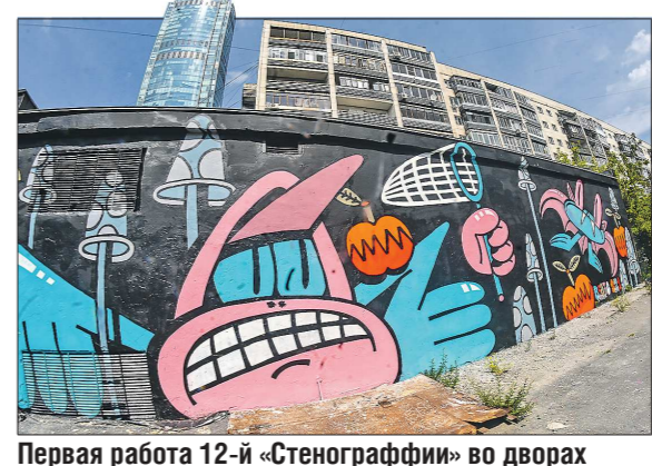
Первая работа 12-й «Стенографии» во дворах на улице Малышева, 84

Подготовлено в соответствии с критериями, утвержденными приказом Департамента информационной политики Свердловской области от 09.01.2018 №1 «Об утверждении критериев отнесения информационных материалов, публикуемых государственными учреждениями Свердловской области, в отношении которых функции и полномочия учредителя осуществляет Департамент информационной политики Свердловской области, к социально значимой информации».