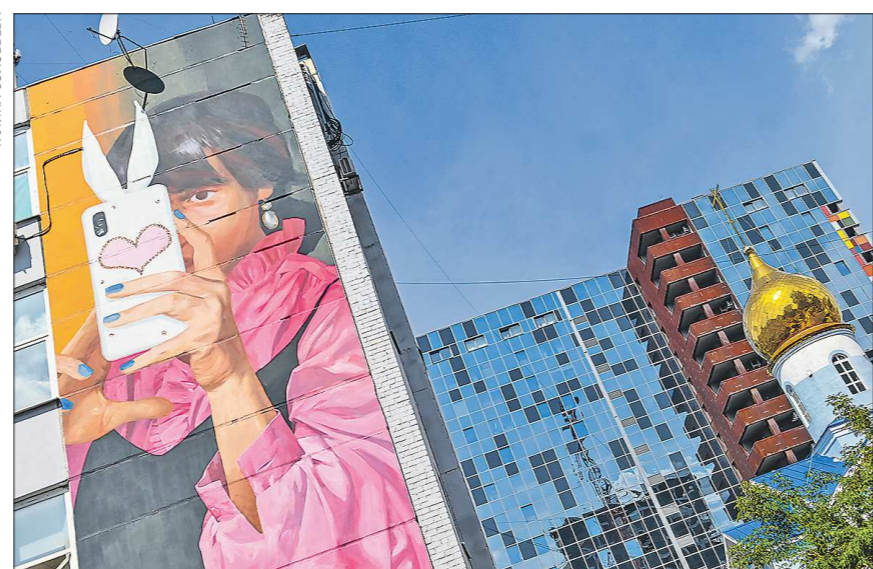
«Портрет девушки, делающей селфи» на улице Шейнкмана, 57