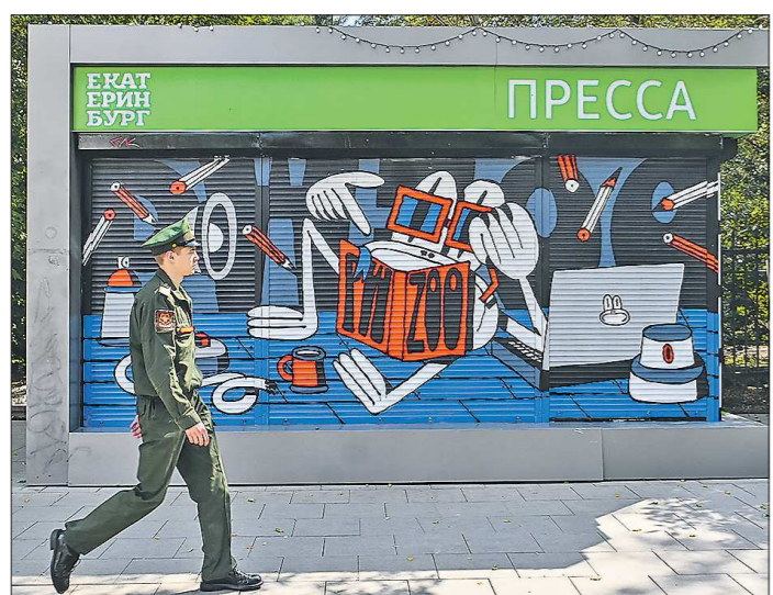
«Жабий дом», пр. Ленина, 56. Кстати, работу видно вечером, когда киоск закрыт