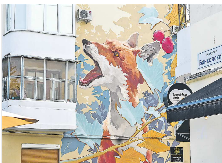
«Близок локоток, да не укусишь», пер. Банковский, 10