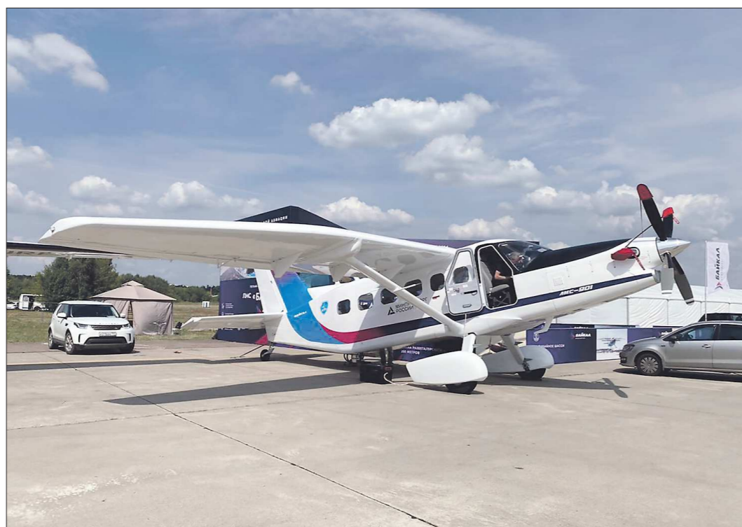
Разработанный конструкторами УЗГА 9-местный пассажирский самолёт «Байкал» — одна из мировых премьер выставки МАКС-2021

Сообщается, что выставка достижений творцов отечественной авиационной и космической техники будет работать до конца текущей недели. Среди наиболее интересных экспонатов военной линейки нынешнего салона специалисты выделяют новейший российский истребитель пятого поколения, разработанный в КБ Сухоого, усовершенствованные боевые вертолёты Ми-35 М и Ми-8 АМШТ, разведывательно-ударный беспилотник «Орион», зенитную ракетную систему С-350 «Витязь» и другие. Продукция общегосударственного назначения отрасли