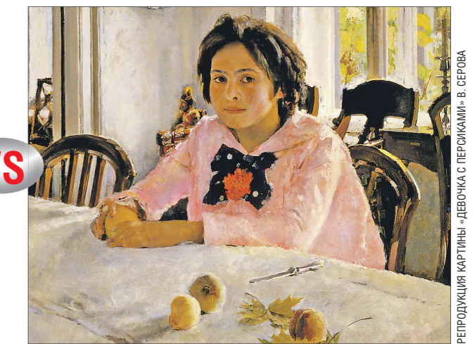
«Валентин Серов. К 150-летию со дня рождения», Третьяковская галерея

Итак, к обещанным цифрам. В 2015-2016 годах выставку Третьяковской галереи «Валентин Серов. К 150-летию со дня рождения» за сто дней посетили 485 тысяч человек. За первые выходные – 4,5 тысячи человек, а за вторые – 5,5 тысячи. Складывается: получается, за два уик-энда – 10 тысяч человек. У «Эрмитажа-Урала» за две недели – 12 тысяч посетителей (из которых основная часть, конечно, тоже пришла на выходные). Понятно, что статистика приблизительная. И как сложится в ближайший три месяца с посещаемостью центра, предугадать сложно. Но если смотреть