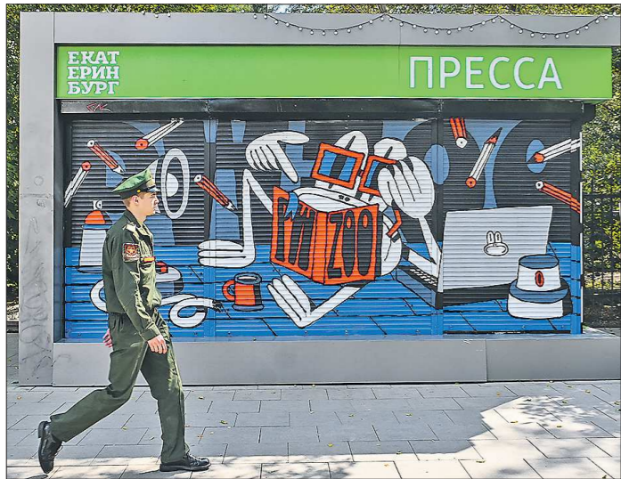
«Жабий дом», пр. Ленина, 56. Кстати, работу видно вечером, когда киоск закрыт