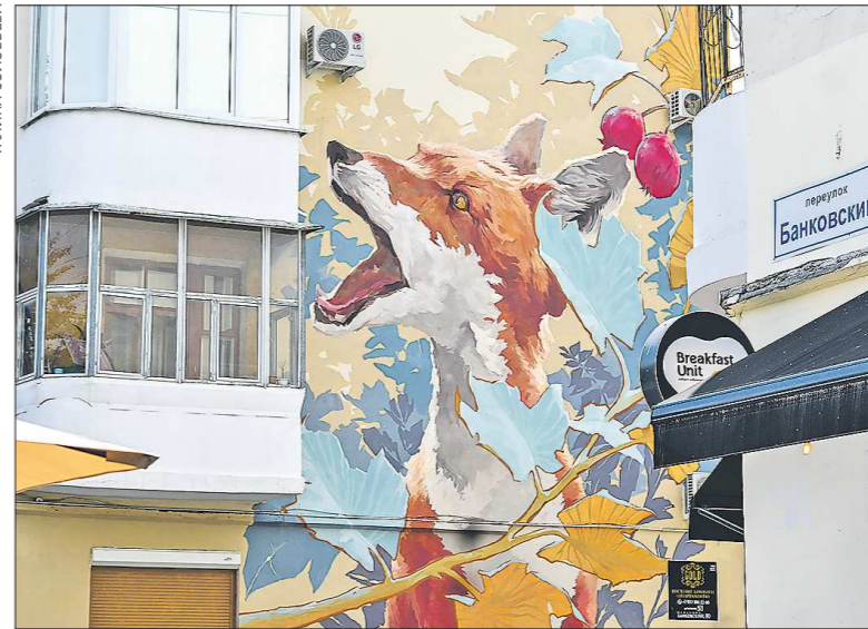
«Близок локоток, да не укусишь», пер. Банковский, 10