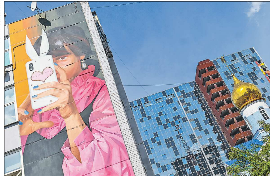
«Портрет девушки, делающей селфи» на улице Шейнкмана, 57