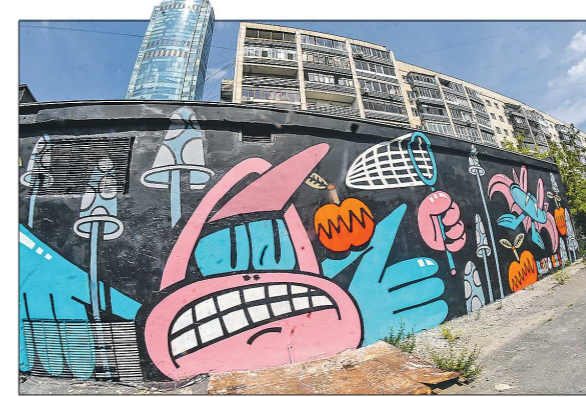
Первая работа 12-й «Стенографии» во дворах на улице Малышева, 84

Подготовлено в соответствии с критериями, утверждёнными приказом Департамента информационной политики Свердловской области от 09.01.2018 №1 «Об утверждении критериев отнесения информационных материалов, публикуемых государственными учреждениями Свердловской области, в отношении которых функции и полномочия учредителя осуществляет Департамент информационной политики Свердловской области, к социально значимой информации».