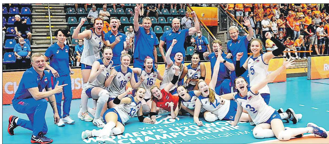
Победное фото сборной России после заключительного матча турнира