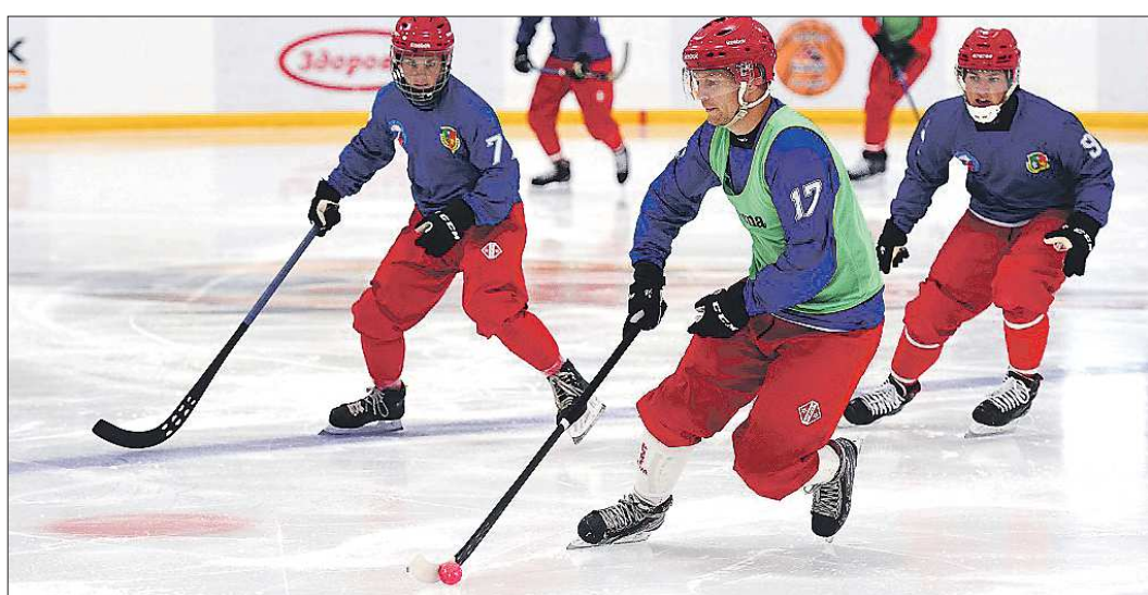
В то время, как соперники тренируются на крытых больших катках, «Уральский трубник», как обычно, готовится в «коробке»

Подготовлено в соответствии с критериями, утверждёнными приказом Департамента информационной политики Свердловской области от 09.01.2018 №1 «Об утверждении критериев отнесения информационных материалов, публикуемых государственными учреждениями Свердловской области, в отношении которых функции и полномочия уполномоченного уполномоченного Департамента информационной политики Свердловской области, к социально значимой информации».