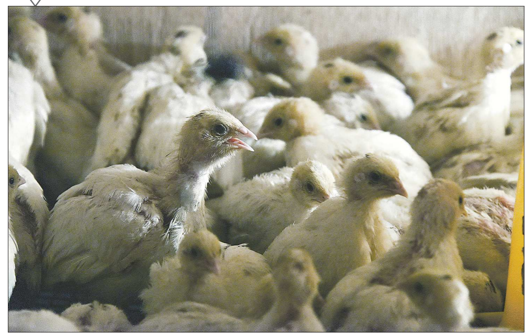
При содержании перепелов нужно соблюдать три главных условия: световой режим, температура и правильный корм

«А не завести ли в хозяйстве перепелов?»